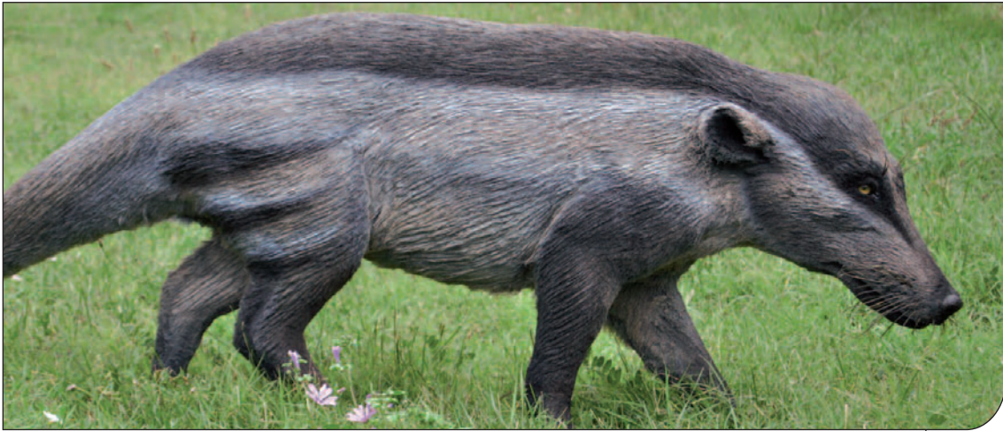
Fig. 5. Ricostruzione di Pakicetus (Archaeoceti) realizzata per la sala dedicata alle origini dei cetacei del Museo di Storia Naturale dell'Università di Pisa.

Reconstruction of Pakicetus (Archaeoceti) made for the room dedicated to the origins of cetaceans in the Museum of Natural History, University of Pisa.