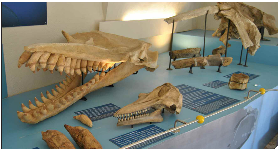
Fig. 4. Particolare della sala dedicata alle origini dei cetacei del Museo di Storia Naturale dell'Università di Pisa.

Finally, exhibition paths dedicated to fossil cetaceans have recently been set up in some Italian museums. They flank the original specimens with three-dimensional reconstructions and/or tactile objects, giving the visitor a simpler message and more information on the evolutionary history of cetaceans. Some examples are the room dedicated to the origin of cetaceans in the Museum of Natural History, University of Pisa (figs. 4, 5), the halls of the "Il Mare Antico" Palaeontology Museum in Salsomaggiore Terme and the reconstructions of cetaceans from the Pietra Leccese in the Environment Museum, University of Salento.