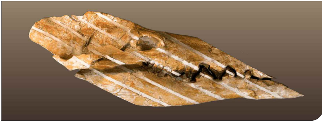
Fig. 2. Cranio e mandibola (MSNUP I-15459) in veduta laterale dell'olotipo di Aegyptocetus tarfa (Archaeoceti, Protocetidae) dell'Eocene medio dell'Egitto, conservato presso il Museo di Storia Naturale dell'Università di Pisa. Skull and mandible (MSNUP I-15459) in lateral view of the holotype of Aegyptocetus tarfa (Archaeoceti, Protocetidae) from the Middle Eocene of Egypt, conserved in the Museum of Natural History, University of Pisa.