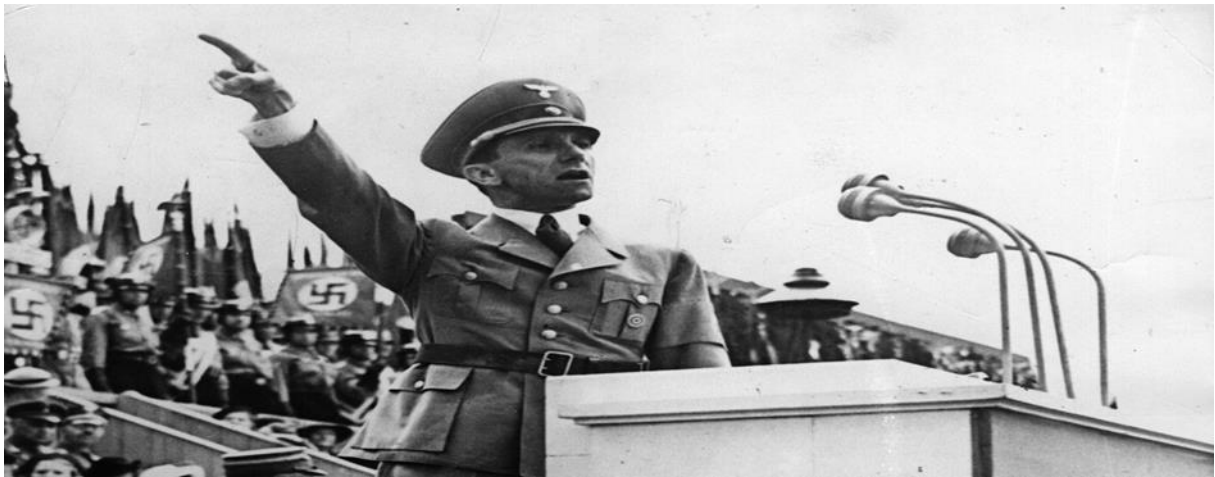
Slika 5. Joseph Gobbels – Hitlerov ministar propagande prilikom održavanja jednog od govora