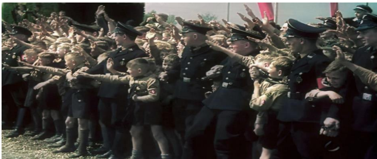
Slika 4. Vojnici pokušavaju zadržati svjetinu da ne prepiječi put Hitlerovom automobilu.

Efekt kompozicije vlaka , kako ga naziva Šaran, sličan je instinktu krda. Ovdje nije samo riječ o ponašanju, već dolazi i do promijene vjerovanja, dakle mogli bi smo reći da su ti ljudi jednostavno bili indoktrinirani, te su prihvatili nacističke ciljeve kao svoje, u tolikoj mjeri da neki (živi) Nijemci još i danas vjeruju da je Hitlerovo „učenje“ bilo sasvim opravdano. (Šaran, www.matrixworldhr.com , 2016b).