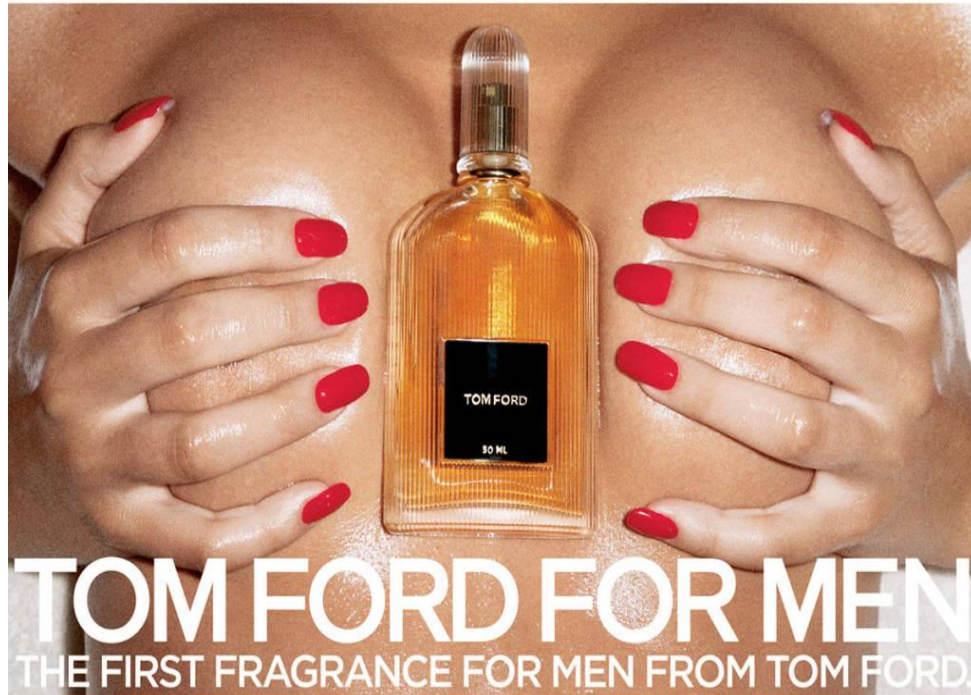
Slika 4.3.2 Privlačenje muških potrošača izazovnom slikom ženskog tijela ( www.pinterest.com )

Reklame koje služe isključivo za muške potrošače gotovo uvijek koriste eksplicitan ženski lik. Neke reklame idu toliko daleko da ne prikazuju cijelu žensku osobu, već samo određeni dio tijela. Često je puta riječ o ženskim grudima, stražnjici i sl.