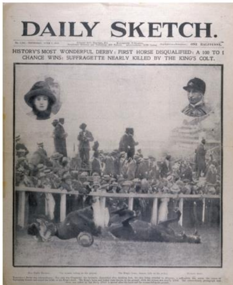
Slika 4.2. Naslovnica novina Daily Sketch o smrti Emily Davison

žene dobiju pravo glasa. Na Slici 4.2. prikazana je naslovnica novina Daily Sketch od 8. lipnja 1913. godine.