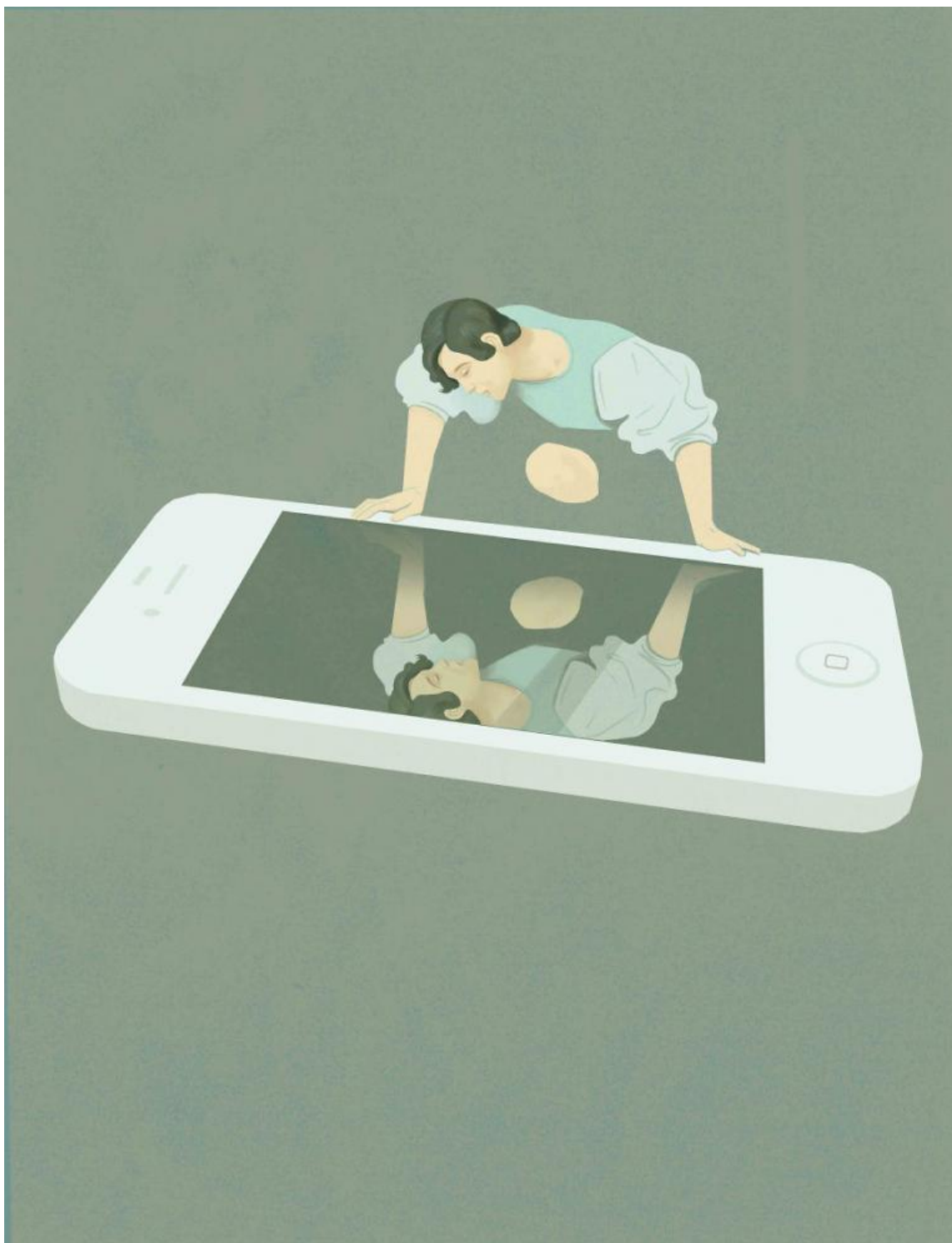
Illustrazione di Marco Melgrati.

Se è vero, allora, che il bagno di contemporaneità garantito dalla morte degli altri ci posiziona incessantemente, si può dire qualcosa delle forme generate da questi posizionamenti, che sono, manco a dirlo, forme politiche. Esse possono, per esempio, chiederci di cancellare la nostra individualità in nome di quell' accordo categorico con l'essere che secondo Kundera era la caratteristica fondamentale del Kitsch. Dall'11 Settembre in poi, si sono diffusi slogan ad hoc: siamo tutti americani (ricalcato dal kennediano Ich bin ein Berliner ), Je suis Charlie Hebdo etc. Queste frasi, diventate virali sui social network, costituiscono forme collettive totali, senza possibilità di distanza, di ironia, di diserzione, richiedendo al singolo di adeguarsi completamente ad esse. Egli deve farsi medium "immediato", fedele, integrale, conformando la propria bacheca, alla forma politica del lutto. D'altra parte, casi meno drammatici, come la morte naturale di un personaggio pubblico, danno forma a comunità provvisorie in cui il contributo del singolo è più significativo. In casi di questo genere, la partecipazione al cordoglio assume la forma della lista , della variazione sul tema, con proliferazione di necrologi e ricordi insieme ironici e affettuosi. È il caso di uno stilema tipico della rete, quell'" insegna agli angeli " che a ognuno sarà capitato di leggere nel proprio stream , in riferimento al talento della star di turno ("Bud Spencer, insegna agli angeli come si fa a botte!").