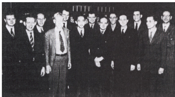
Moore School számítógépes projekt munkatársai

A számítógépek felépítésével kapcsolatosan egy igen lényeges, alapvető elgondolás – mely a működést vezérlő kódot is az operatív memória adatainak sorába rendelte, és melyet Neumann elvként ismerünk – alapvető következményekkel jár. (ASPRAY 2004 [1990]) Az úgynevezett hardver és szoftver szétválasztásából adódóan a korábban megépített eszközök funkcionális rugalmasságához képest új lehetőségek bontakoztak ki.