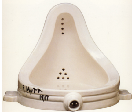
Marcel Duchamp – „Forrás”

(Talált tárgy) filozófiának első darabja volt, mely irányzatban az alkotás folyamata helyett az ötlet, a kiválasztás válik lényegessé.