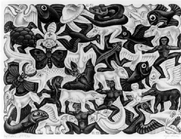
Escher: Plane filling I. 1951

A művészet eszközeként is megjelenik ez a lehetőség Escher grafikáiban.