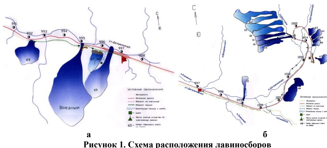
Рисунок 1. Схема расположения лавиноборов

Склоны покрыты отдельными скальными глыбами. При этом коэффициенты трения зависят от угла наклона склона и площади лавиносбора и изменяется в пределах от 0,3 до 0,6. Эти коэффициенты должны учитываться при проектировании лавинозащитных сооружений [1,2].