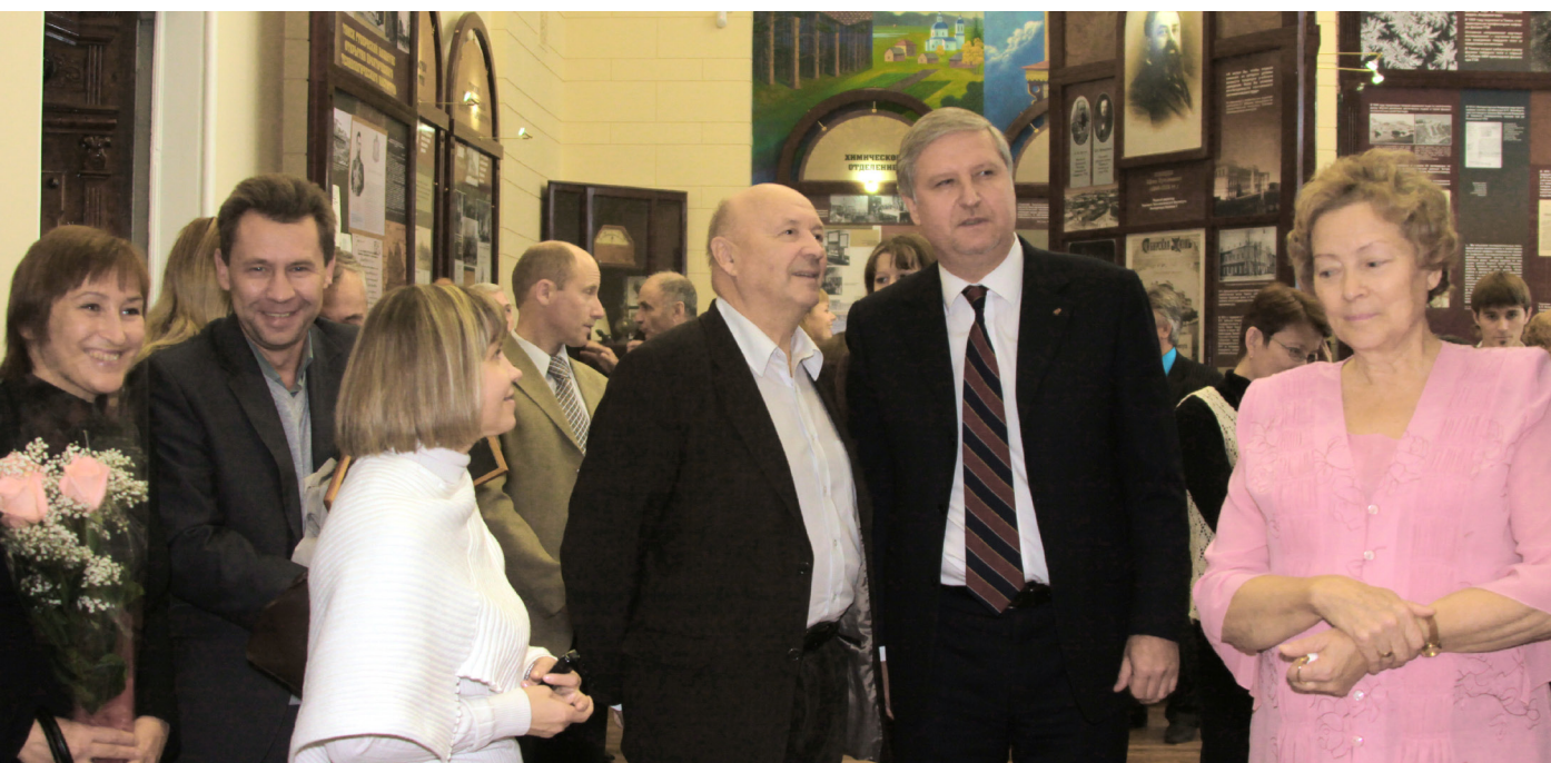
8 октября 2010 года после ремонта Музей истории ТПУ вновь распахнул свои двери для посетителей

педии ТПУ» от стандартных бумажных энциклопедий состоит в том, что автором статьи в ней может быть любой желающий, если ему есть что рассказать об одном из ведущих университетов Рос-