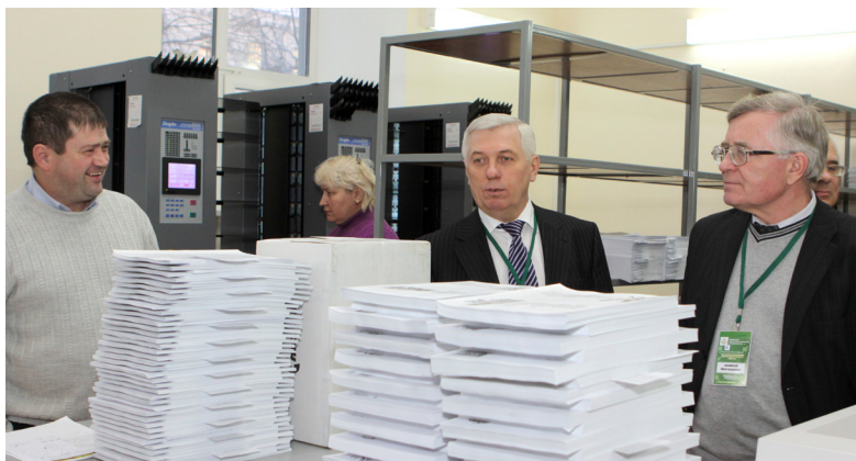
В издательстве ТПУ

Even today we can mark a number of achievements and projects successfully implemented by the Division's staff. Those are On-line Encyclopedia of TPU ( www.wiki.tpu.ru ), News Service on www.news.tpu.ru , 3D-tour of TPU Campus on http://www.tpu.ru/html/3d-tour.htm available for Internet users all over the world, the promotion website on www.115.tpu.ru devoted to the 115th anniversary of TPU, a renewed website of TPU Alumni Association. Owing to the Division of Communication Policy in 2011 TPU's website occupied the 791st position in the Webometrics Ranking (world ranking of universities) among world universities and the 8th position among Russian universities.