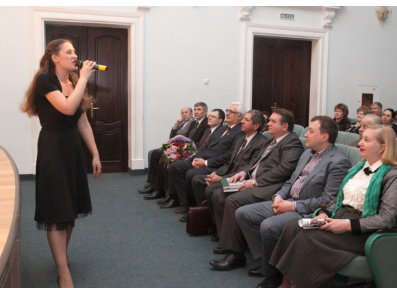
На праздновании 80-летия газеты «За кадры»

В рамках решения поставленных задач, на основе выпускаемой с 2007 года ежемесячной видеохроникальной программы «Видеонювости ТПУ», подготовлен и набирает силу новый масштабный проект по созданию и развитию высокотехнологичной