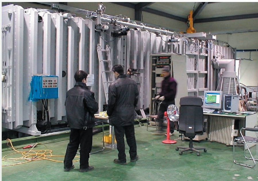
Магнетронные источники нанесения катализирующих покрытий методом магнетронного напыления до 1000 м 2 в сутки, изготовленные сотрудниками ТПУ

Модернизированная образовательная программа подготовки магистров по направлению "Физика конденсированного состояния" разработана на кафедре общей физики ЕНМФ на основе компетентностного подхода, кредитной стоимости результатов обучения в целом и отдельных дисциплин, в частности. Программа инвариантна зарубежным аналогам. Ядро концепции формирования компетенций составляет положение об учёте интересов выпускника и работодателя. При разработке кредитной стоимости результатов обучения наибольшие кредиты имеют компетенции, основанные на способностях к самостоятельной творческой деятельности, и формирующие их дисциплины.