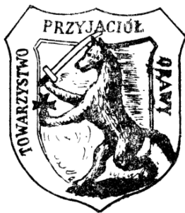
Fot. 1. Godło