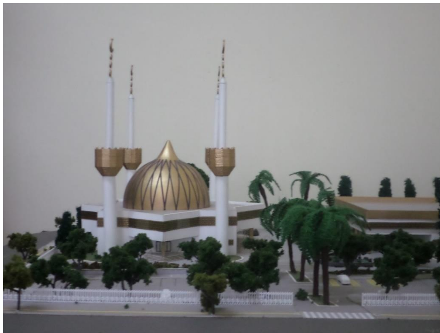
Imagen 2 - Ejemplo de auto reafirmación de la identidad

Es importante destacar: La identidad religiosa y la concepción de cultura que se tiene desde el punto de vista de esta sociedad específica.