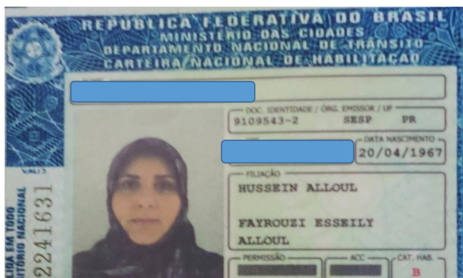
Imagen 3 - Reivindicación del velo en las políticas de Foz do Iguaçu

En este momento de la entrevista se nombra el término de “lucha” con cautela de parte de la entrevistada, se pronuncia, pero no de forma negativa, sino como una manera de entender que hay que respetar los derechos, donde acá entrarían los religiosos, la cuestión del velo hizo con que la SBI buscara y ayudara a las mujeres de NSF con los contactos gubernamentales de Foz do Iguaçu donde ellas pudieran expresar y argumentar esta situación y reivindicar sus derechos de poder viajar e ir a cualquier parte sin tener que quitar en ninguna parte, ni en ninguna institución del estado el velo.