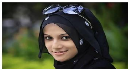
Foz do Iguaçu, no oeste, abriga mais de 22 mil imigrantes e descendentes

O uso de hábitos e véus islâmicos nas fotos da Carteira Nacional de Habilitação (CNH) foi autorizado nesta terça-feira (9) pelo governador do Paraná , Beto Richa (PSDB). A decisão foi tomada com base no artigo 5, inciso 8, da Constituição Federal, que diz que "ninguém será privado de direitos por motivo de crença religiosa".