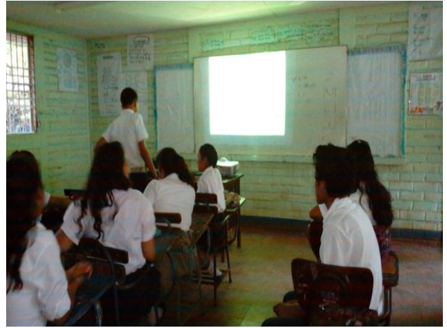
Figura 7: presentación de un video del patrimonio cultural para la realización de las maqueta.

El docente procedió a entregar el material de apoyo se procedió a pasar un video sobre el patrimonio cultural para que los estudiantes conocieran cuales son nuestros patrimonio ya que muchas veces desconocemos cosas que son de gran importancia para la sociedad. nos reunimos con los estudiantes para la realización de las maquetas se formaron 3 grupos de seis integrantes los cuales eligieron reproducir uno de los patrimonios culturales para presentarlo después sus maquetas todos los equipos participaron en la realización al final se obtuvieron buenos resultados y presentaron trabajos muy bonitos realizado con mucho empeño