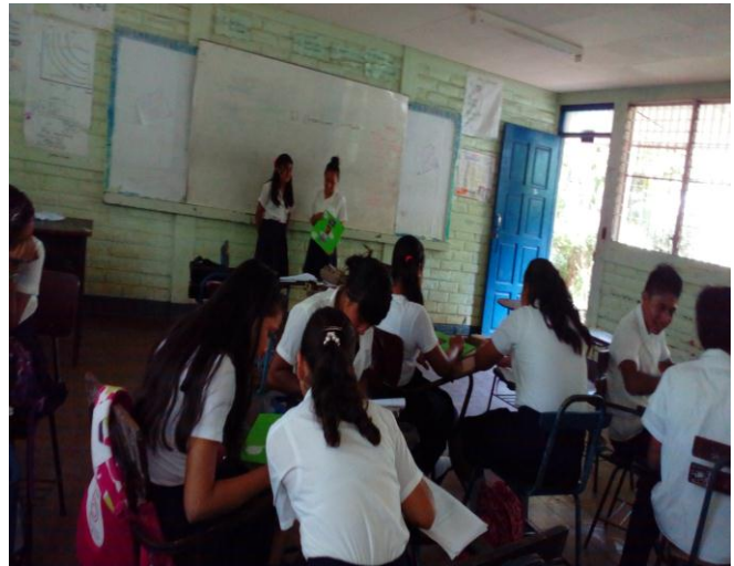
Figura 6 refleja la realización de historietas por parte de los alumnos.

La sesión transcurrió durante un bloque de 45 minutos el docente procedió a entregar el material en el cual tenían que analizar la lectura. Se les facilitó el material cartón para proceder a realizar las historietas en donde se le facilitaron recortes de revistas, pega, tijera, papel lustrillo luego, de la elaboración de las historietas procedieron a exponer cada uno de los grupos donde cada alumno explicó de forma clara lo que comprendieron de la clase