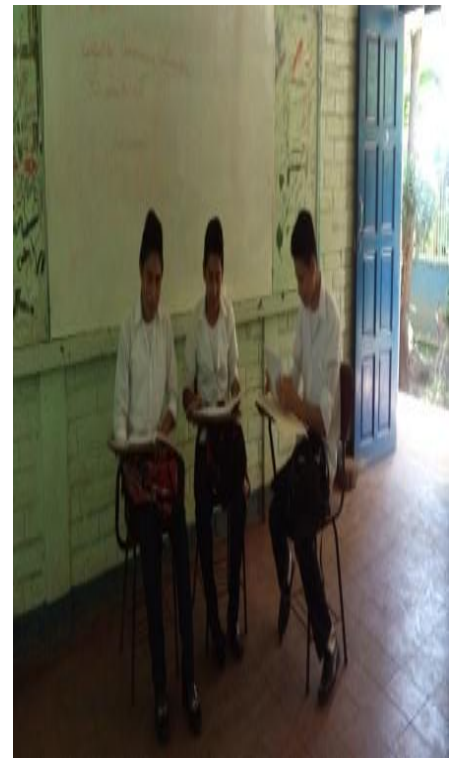
Figura 4 muestra realizando la actividad juego de roles