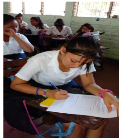
Figura 2: muestra la realización de la guía de estudio.

La sesión trascurrió durante un bloque de 45 minutos iniciando a las 2:58 pm y culminando a las 3:38 pm se inició con la presentación de cada uno de los estudiantes para conocer sus nombres y poder relacionarlos con ellos. Luego de eso procedió a escribir el tema en la pizarra y explicar lo que realizarían en clase se le entregó el material de apoyo con el cual contestarían las preguntas en grupos de tres estudiantes el maestro brindó atención a cada grupo y aclaró cualquier duda que se les presentara.