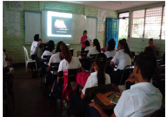
Figura5: la presentación de la canción del Dúo Guarda Barranco días de amar

Presentación del video Días de Amar del Dúo Guarda Barranco cada alumno tenía la letra de la canción. A los alumnos les gustó mucho que pidió que se repitiera nuevamente. Luego realizaron la actividad que consistía en analizar la letra de la canción para seleccionar lo positivo, lo negativo y lo interesante entregaron el informe luego de eso los alumnos pasaron a la pizarra para explicar lo que comprendieron, brindaron muchos aportes y valoraron la gran importancia de practicar los valores, para concluir los estudiantes tuvieron la iniciativa que todos los presentes cantaron la canción Días de Amar logrando la participación de todos.