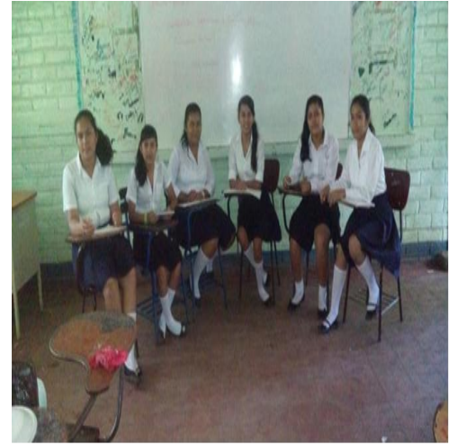
Figura 3 muestra la realización del Phillips 66

La sesión de clase transcurrió durante los dos últimos bloques de clase iniciando 3:55 pm se recordó el tema anterior a través de la dinámica el lápiz hablante, los alumnos se sintieron alegres y a la vez atemorizados a la hora que el lápiz pasaba de mano en mano. Luego se inició con el tema que correspondía ese día el docente procedió a dar una breve explicación se le entrega el material. Con el cual tenían que trabajar para la realización de dicha actividad se formaron 3 grupos de 6 estudiantes se escogió un grupo de estudiantes para que expusieran la información con sus demás compañeros en donde cada alumno duro 6 minutos, luego de esto los demás compañeros aportaron más del tema comentado para reforzar o dar su aporte. La clase termino a las 5: 00 pm.