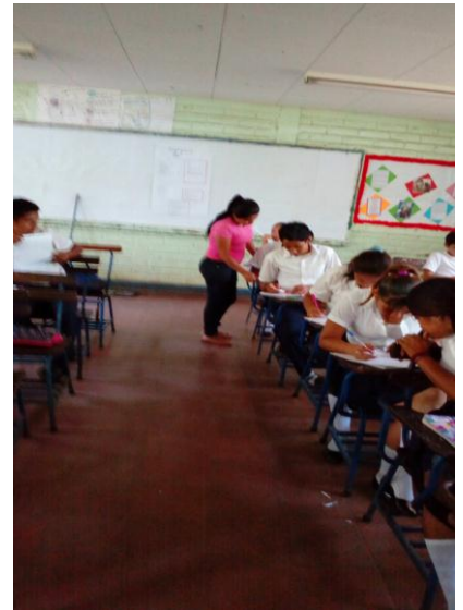
Figura 1: muestra la realización de la prueba diagnóstica

Previo a la primera sesión de clase se conversó con la Directora del Instituto nos presentó al docente el cual los apoyaría con el espacio para que pudiéramos realizar la intervención. posteriormente nos llevó al aula de clase donde el docente les explicó a sus alumnos el motivo de nuestra visita luego de eso nos presentamos con los estudiantes que trabajaríamos se procedió con la realización de la prueba diagnóstica se le explicó en qué consistía y como la tenían que realizar la prueba para la eficacia en nuestros resultados pasábamos observando a cada uno de los alumnos y si algo no comprendían de las preguntas se le explicaba ellos la realizaron en forma ordenada y responsable en un bloque de 45 minutos.