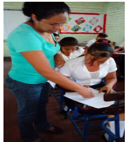
Figura 8: muéstrala realización de la prueba final.