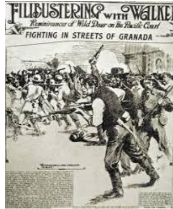
Esta imagen es la que se utilizó en la diagnosis y evaluación final

Pregunta 1 ¿Qué actos refleja esta imagen? ¿Qué te recuerda?