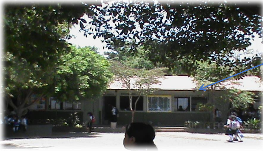
Pabellón de educación primaria

cielo raso y ventanas se encuentra en mal estado.