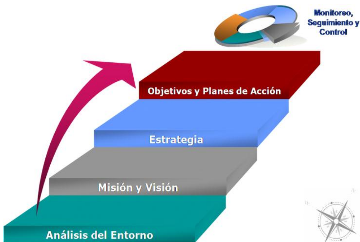
Imagen 2: Monitoreo.

Dado que el docente encargado en la ejecución, podrá identificar de manera específica los resultados finales en comparación con los objetivos propuestos.