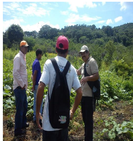
Cultivo de frijol ( Phaseolus )