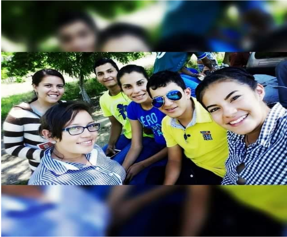
Laguna de Moyúa. Estudiantes de 3er año de agronomía Fotografía 16