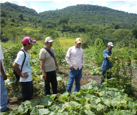
Cultivo de frijol ( Phaseolus vulgaris )