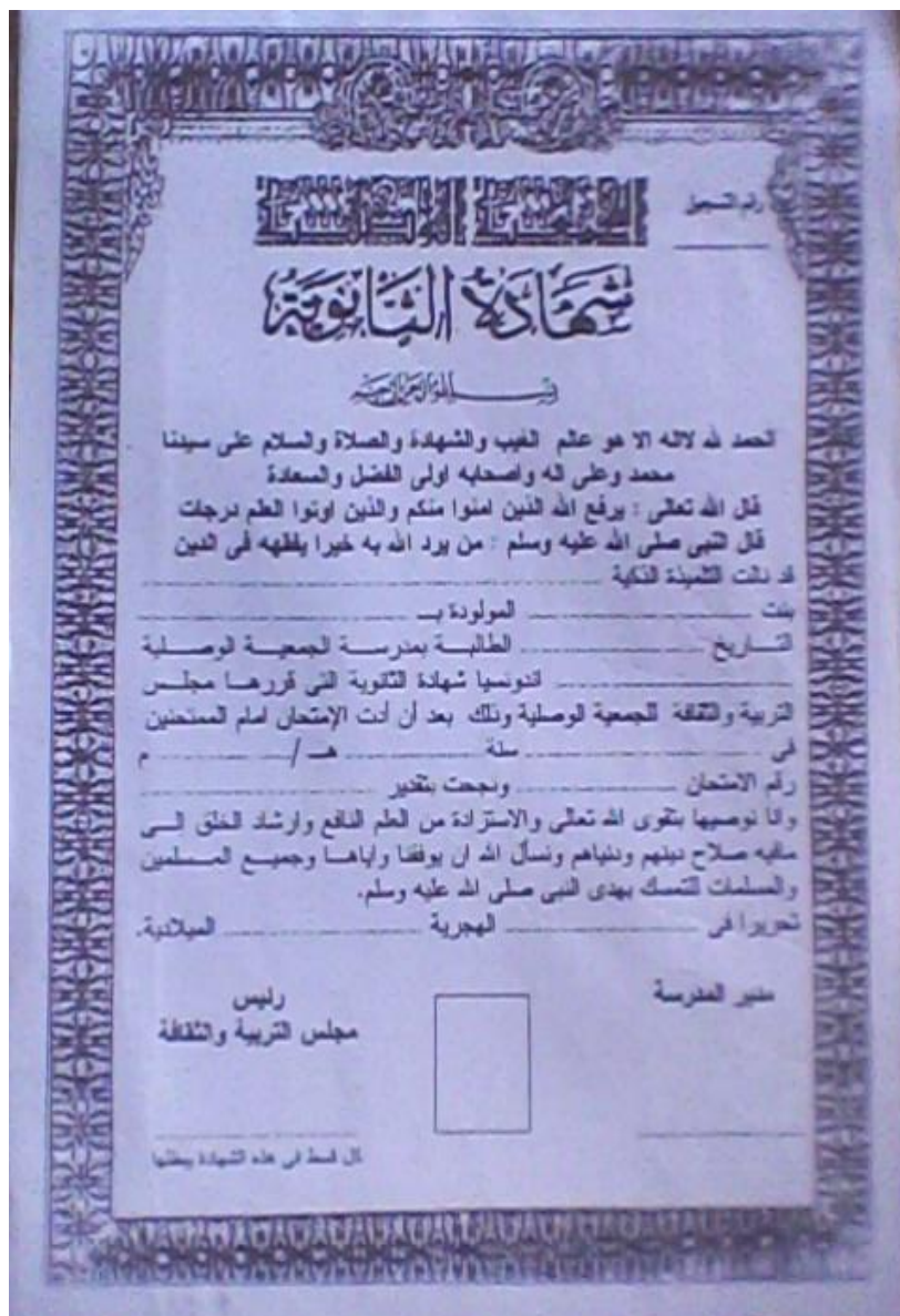
(Gambar 8: Syahadah atau ijazah yang dikeluarkan oleh MPK Al-Washliyah, Tahun 1955-2009)