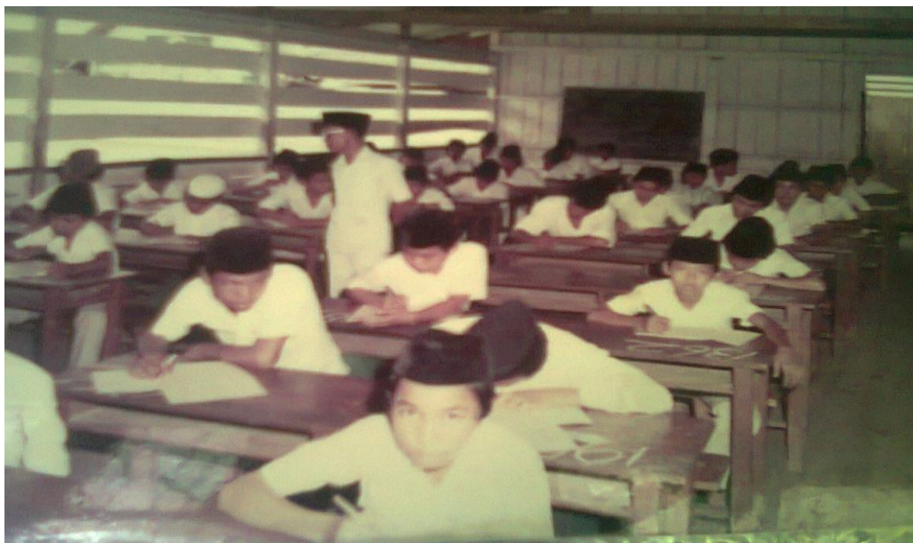
(Gambar 7: Para Murid Sedang Mengikuti Imtihan Umumi, tahun 1980-an)

Sebagai suatu kegiatan yang terencana untuk mengetahui keadaan murid dengan menggunakan instrumen dan hasilnya dibandingkan dengan suatu tolak ukur untuk memperoleh suatu kesimpulan. Fungsi utama evaluasi adalah menelaah suatu objek atau keadaan untuk mendapatkan informasi yang tepat sebagai dasar untuk pengambilan keputusan. Sesuai pendapat Grondlund dan Linn (1990) mengatakan bahwa evaluasi pembelajaran adalah suatu proses mengumpulkan, menganalisis dan menginterpretasi informasi secara sistematis untuk menetapkan sejauh mana ketercapaian tujuan pembelajaran. Evaluasi merupakan kegiatan pengumpulan kenyataan mengenai proses pembelajaran secara sistematis untuk menetapkan apakah terjadi perubahan terhadap peserta