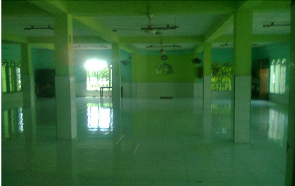
(Gambar 10: Muşolla Yayasan Pendidikan al-Washliyah Dibangunan Permanen Dengan Dana Bantuan Dari Negara Kuwait, Tahun 2009).

Hingga sekarang (2009) bangunan yang ada di Yayasan Pendidikan Al-Washliyah ini meliputi gedung permanen asrama untuk anak yatim piatu dan anak miskin, yang terdiri dari 20 kamar, ruang makan, kamar mandi dan WC, Muşolla, ruang kantor, aula pertemuan, kantin dan gedung madrasah yang terdiri dari 12 ruangan. 58