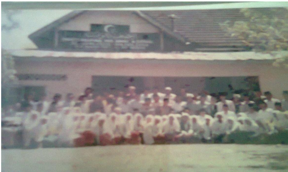
(Gambar 3: Para Murid Berfoto Bersama di Halaman Madrasah)

Para murid yang belajar di Yayasan Pendidikan Al-Washliyah sebahagiannya berasal dari golongan anak yatim piatu dan anak miskin, namun ada juga dari anak-anak di sekitar Yayasan. Mereka belajar sejak pagi pukul 07.30 wib hingga sore pukul 16.00 wib, namun pada pukul 13.00 wib para murid yang berasal dari sekitar Yayasan Pendidikan Al-Washliyah diperbolehkan kembali ke rumah masing-masing untuk makan siang dan kembali belajar pada pukul 14.00 wib.