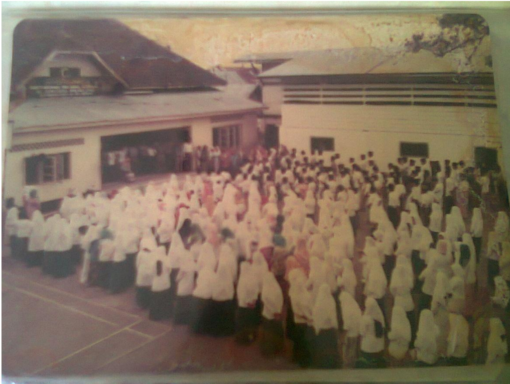
(Para Murid Sedang Berkumpul di Depan Gedung Madrasah Yayasan Pendidikan Al-Washliyah, Jl. Ismailiyah No. 82. Medan, Tahun 1980-an)

Bangunan tersebut masih semi permanen berlantai dua, berdinding setengah batubata dan setengah papan, berlantai batu dan beratap seng. Yang terdiri dari 1 buah gedung untuk asrama anak yatim piatu dan anak miskin dan 1 buah gedung untuk pendidikan yang mempunyai enam ruang terdiri dari tiga ruang di lantai satu dan tiga ruang di lantai dua.