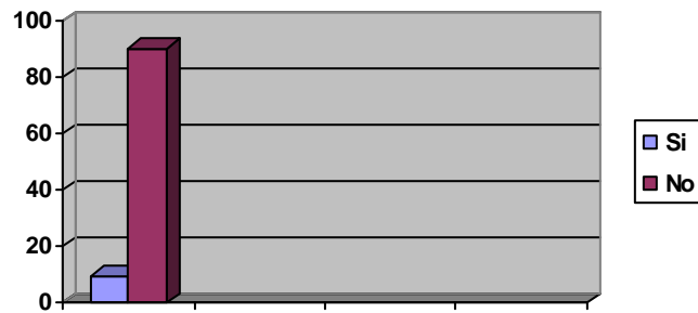
GRÁFICO # 3. Frecuencia con que se realizan las actividades en la comunidad.