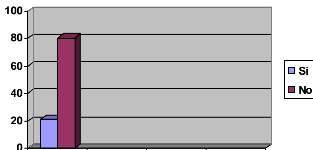
Gráfico #1 Conocimiento de las actividades físico-recreativas