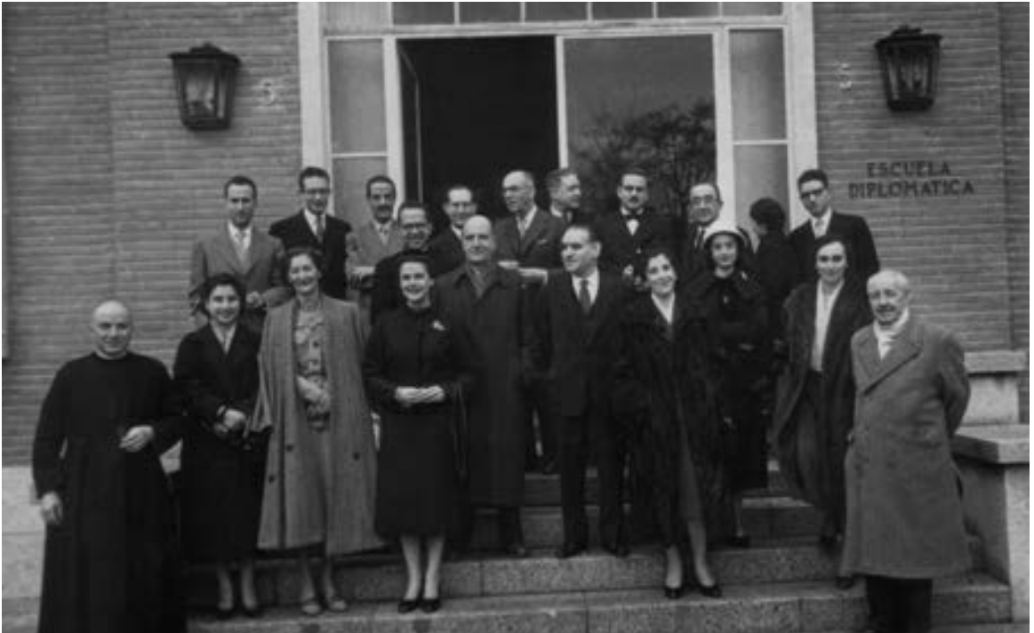
Fotografía de grupo del personal del IHAC en 1961.

El Instituto Hispano-Árabe de Cultura (IHAC), creado en 1954 y cuya dirección fue encomendada a Emilio García Gómez, para entonces el más significado de los arabistas españoles de la época, formó parte del Ministerio de Asuntos Exteriores de España como uno más de los instrumentos políticos de que se sirvió el régimen franquista para afianzar el apoyo de los países árabes en sus relaciones internacionales. La historia del Instituto siguió, por tanto, los avatares de la política exterior española, y acusó igualmente los cambios que culminaron con la instauración de la democracia y del sistema de derechos y libertades reflejado en la Constitución de 1978. A partir de 1988, perdió su nombre original para convertirse en el (hoy también desaparecido) Instituto de Cooperación con el Mundo Árabe, insertado en la Agencia Española de Cooperación Internacional.