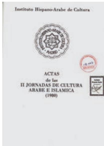
Actas de las II Jornadas de Cultura Árabe e Islámica.1980.

restringido a todas aquellas obras que no llevasen, en su portada, el temido “no se da en préstamo” que el padre Pareja utilizaba con gran liberalidad. Con el tiempo, se iniciaron otros servicios complementarios de información (boletines bibliográficos y de novedades) que contribuyeron, aun con las limitaciones técnicas del momento, a ampliar la difusión de los fondos de la biblioteca.