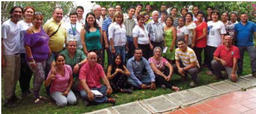
Foto 3. Encuentro Binacional realizado en Ureña, Venezuela, en 2014

¿Cuál es la diferencia entre nacionalidad y ciudadanía?, ¿desde cuándo se es ciudadano?, ¿el sujeto político es el mismo ciudadano?, ¿qué diferencia hay entre ser ciudadano y ejercer la ciudadanía?, ¿cómo se vincula la ciudadanía y la identidad?, ¿cómo estaría definida la ciudadanía desde lo social y cultural?, ¿qué ciudadanía ejercen los jóvenes?, ¿qué formación ciudadana deben recibir? y ¿cómo se configura la ciudadanía en un espacio de tensión entre los ordenamientos jurídicos de las naciones fronterizas?