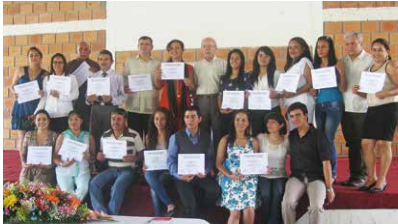
Foto 8. Graduación del Diplomado en Formación Política y Ciudadana. Escuela Arauca-Guasdalito. 2014