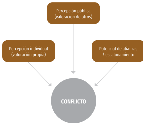
Gráfica 1. Tres elementos constitutivos de los conflictos.

+ Condición 1. Percepción (valoración propia). El primer elemento de esta definición implica que debe existir una percepción por parte de los involucrados de que, en efecto, existe una incompatibilidad de sus intereses en relación con un asunto concreto. En otras palabras, los actores involucrados directamente interpretan, a partir de ciertos 'marcos cognitivos' (entendidos como formas de ver el mundo), los elementos de la disputa. Al parecer obvia, esta primera acotación excluye todas aquellas situaciones de conflicto que experimentamos cotidianamente pero que, dentro del esquema de prioridades que orientan nuestra acción, consideramos irrelevantes: no nos esforzamos por comprenderlas ni las valoramos como un acontecimiento que nos afecta.