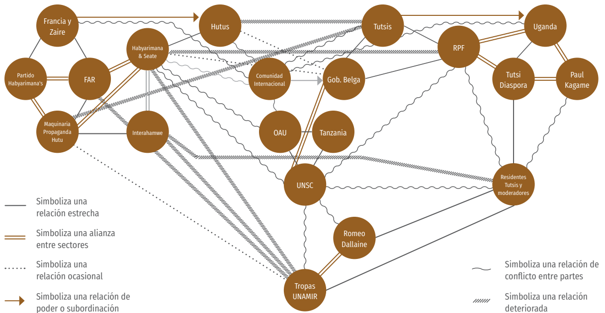
Gráfica 3. Tipos de relaciones sugeridas para estructurar el mapa de actores.