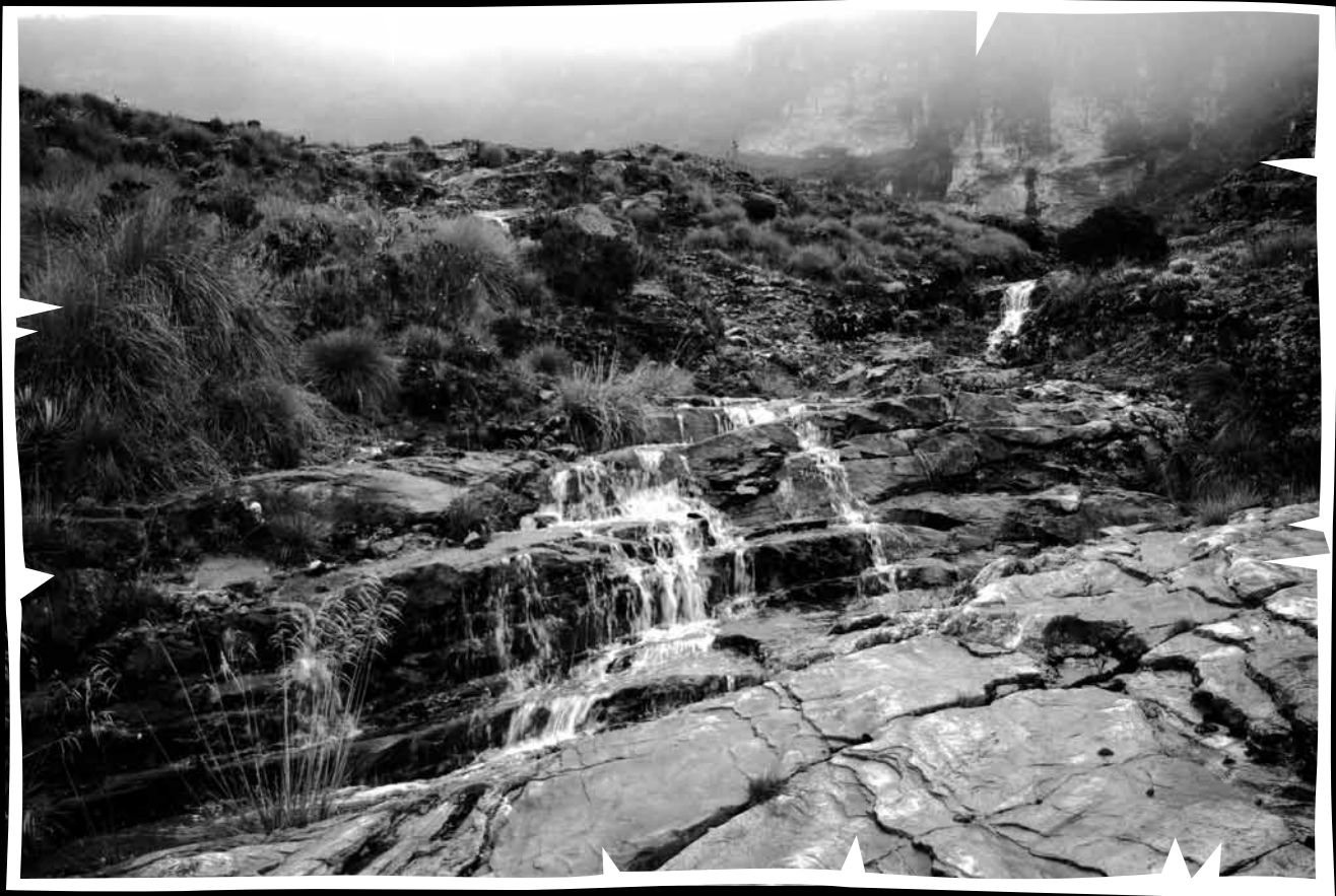
Riachuelo, ubicado en la vía a la Laguna de las Calles del municipio de Vetás (Santander), evidenciando que el Páramo de Santurbán es un gran surtidor de agua. 2011.