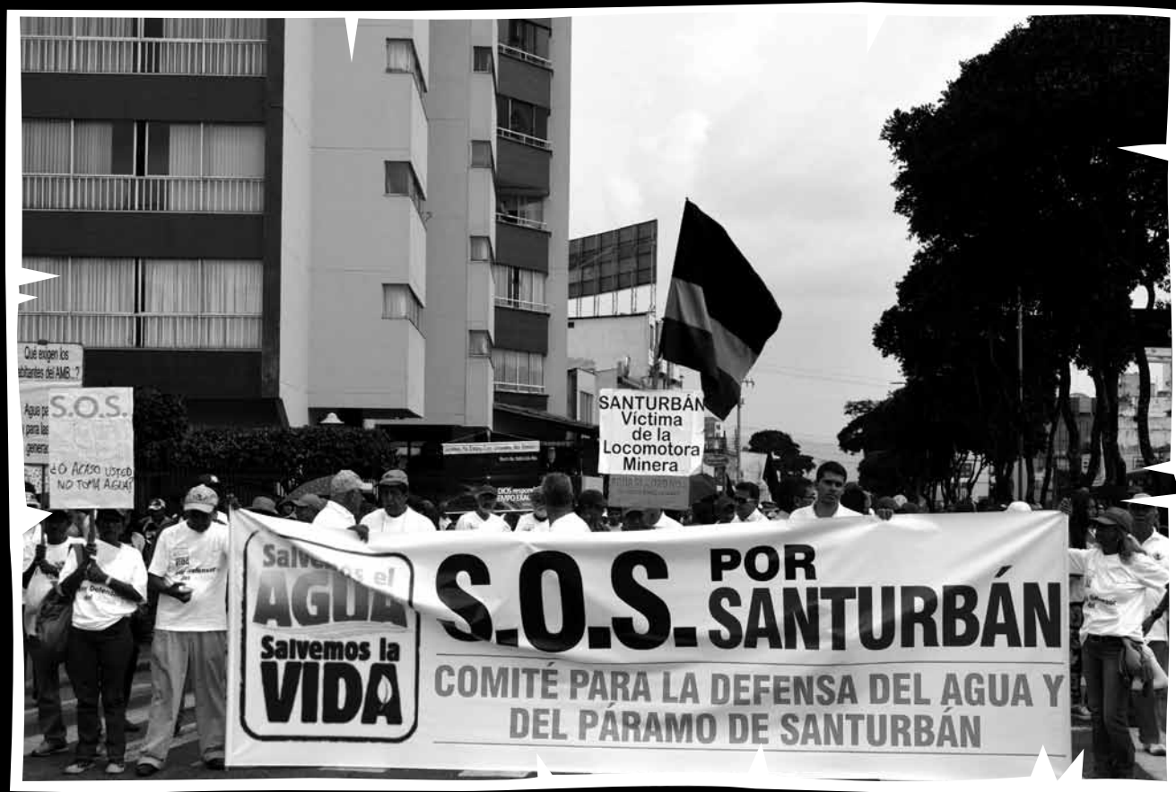
SOS por Santurbán. El 24 de abril de 2015, alrededor de 40 mil personas, salieron una vez más a la calle a protestar por la delimitación del páramo de Santurbán, medida que legitima la megaminería en el páramo. Bucaramanga (Santander), abril 24 de 2015.