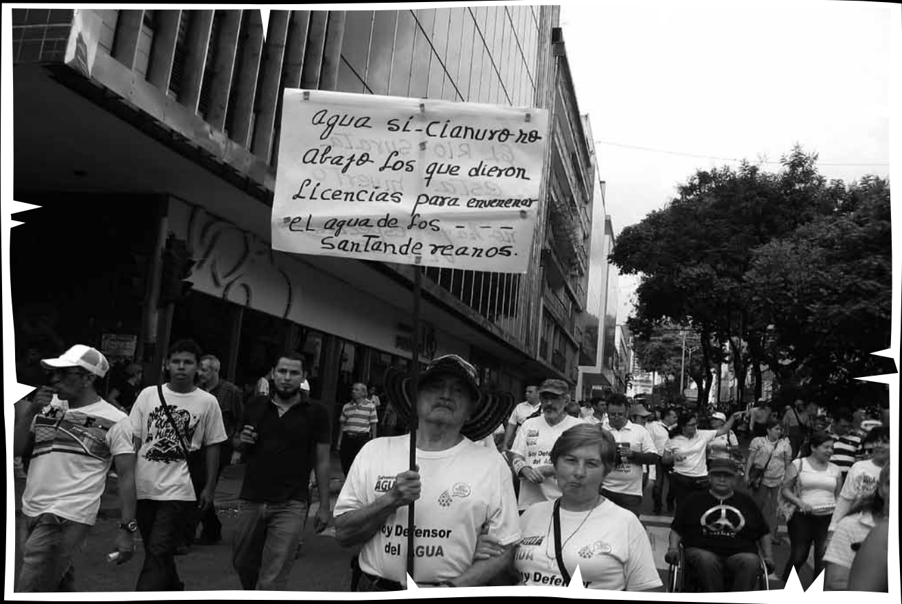
"Agua sí" consigna con la que las y los santandereanos exigen que las multinacionales no exploten el Páramo de Santurbán. Movilización realizada en Bucaramanga (Santander) el 25 de abril de 2015, exigiendo al gobierno nacional NO a la delimitación de Santurbán para las empresas mineras.