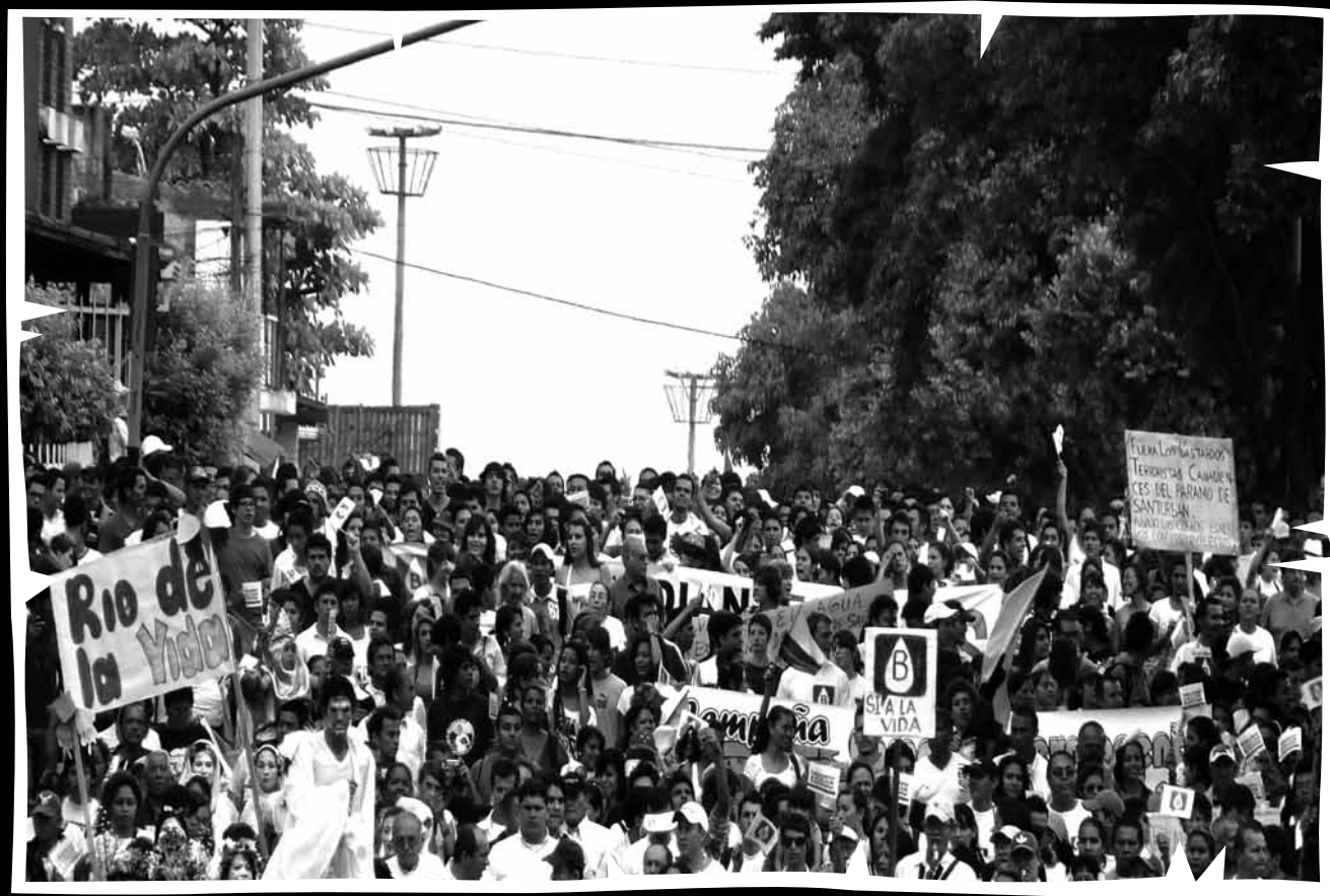
Un río de gente. Marcha Cien Voces por el Agua. Desde la primera convocatoria, la población de Bucaramanga y el área metropolitana ha contestado enérgicamente, desde todos los sectores sociales: estudiantes, docentes, trabajadores públicos, informales, empresas privadas, juntas de acción comunal, entre otros. Bucaramanga (Santander), febrero de 2011.