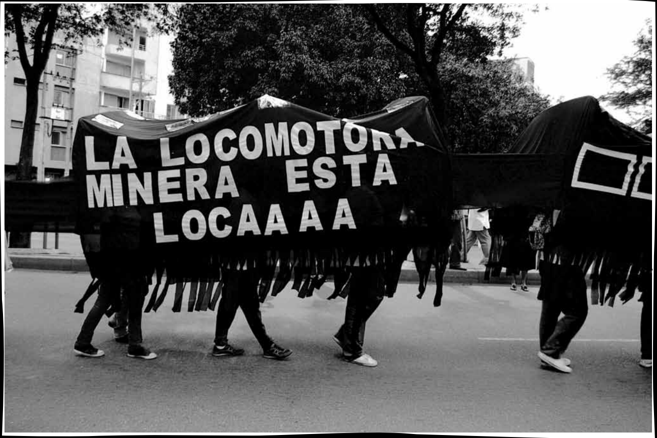
Locomotora locaaaa. Forma creativa de expresión y participación popular en las movilizaciones por la defensa del agua y el páramo de Santurbán, para rechazar la política extractivista que atenta contra el agua. Movilización de las 100 Voces por el Agua. Bucaramanga (Santander), marzo 15 de 2013.