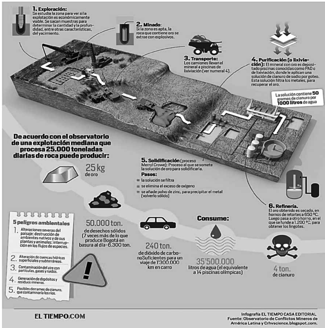
Gráfico 2. Minería a cielo abierto y sus consecuencias ambientales