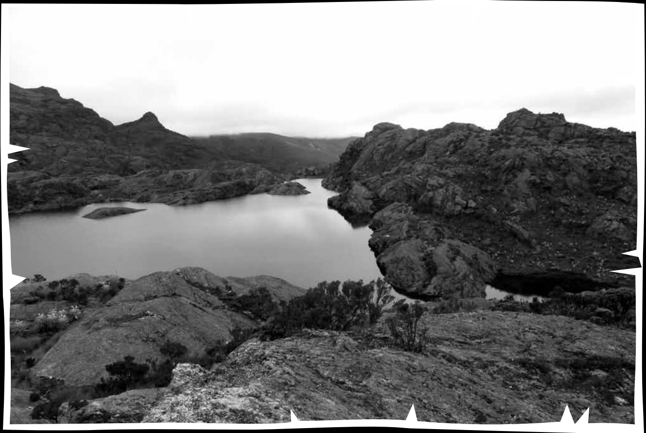
Laguna La Pintada. Es una de las tantas lagunas que se forman por la absorción de la humedad presente en el ambiente, la llamada lluvia horizontal. De ella dicen que sólo se deja ver de algunas personas, variando su color entre el ocre, el verde o el azul profundo. Vetas (Santander), agosto de 2011.