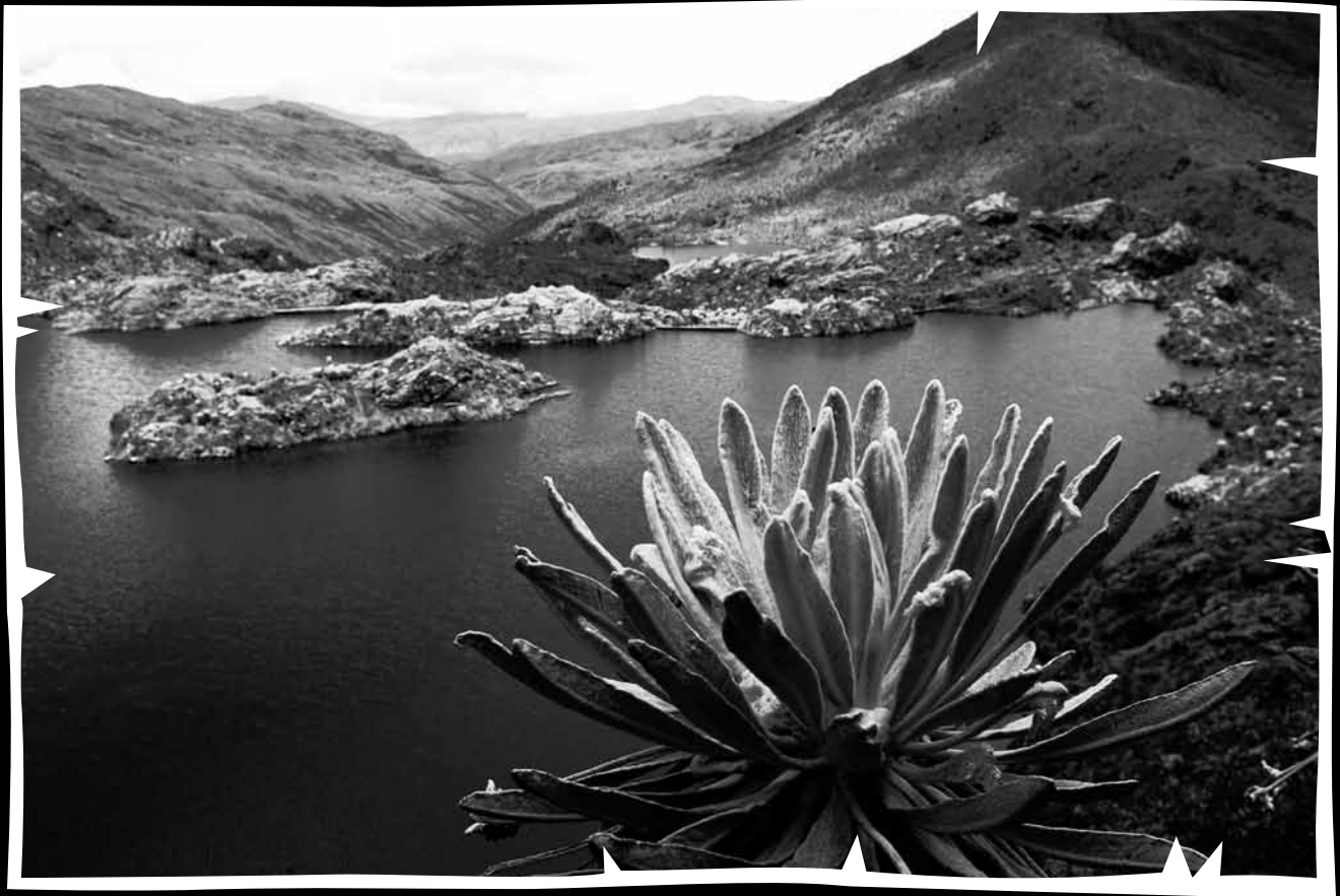
Vigía de la Laguna Verde, municipio de Vetas (Santander). Una muestra de la integralidad del complejo lagunar compuesto por 84 lagunas. 2011.