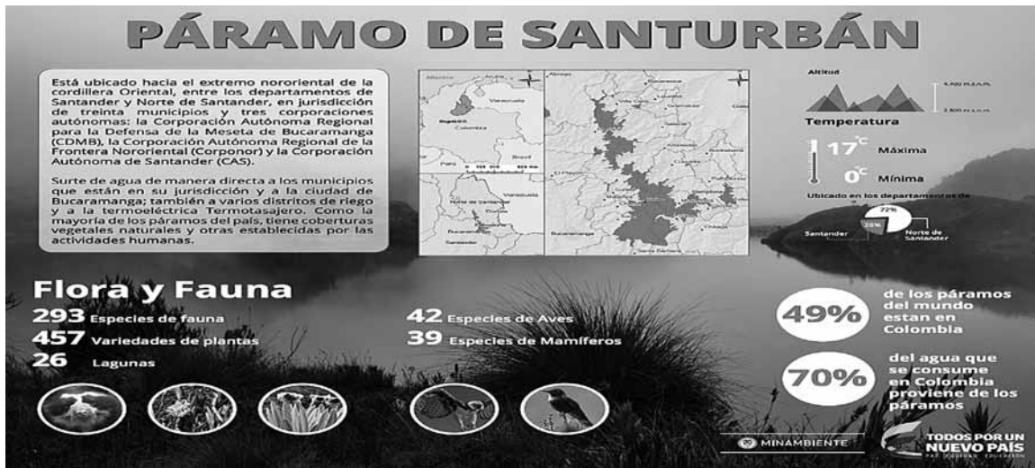
Gráfico1. Información general sobre el Páramo de Santurbán