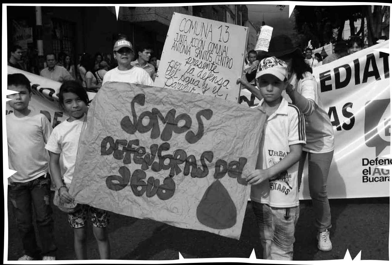
"Santurbán se respeta, el agua se defiende", la defensa del agua convoca a la población en general. Movilización realizada en Bucaramanga (Santander), febrero de 2011.

ACTUALIZACIONES 1: Casos correspondientes a años anteriores que no habían sido publicados o que ameritan ser publicados porque se conocieron nuevos datos más precisos relativos al número de víctimas o sus identidades, fechas, presuntos responsables y ubicación geográfica.