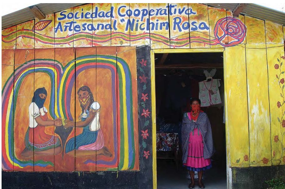
Cooperativa de mujeres artesanas "Nichim Rosa" en el caracol zapatista de Oventic "Resistencia y rebeldía por la humanidad", Chiapas (México). Foto: Luciana García Guerreiro, 2007.