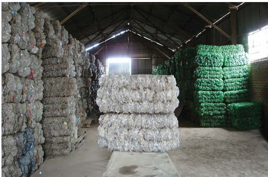
Basurero ecológico y compactadora de plásticos. Emprendimiento productivo de la UTD de Mosconi. Salta. Foto: Sol Arrese, 2005.