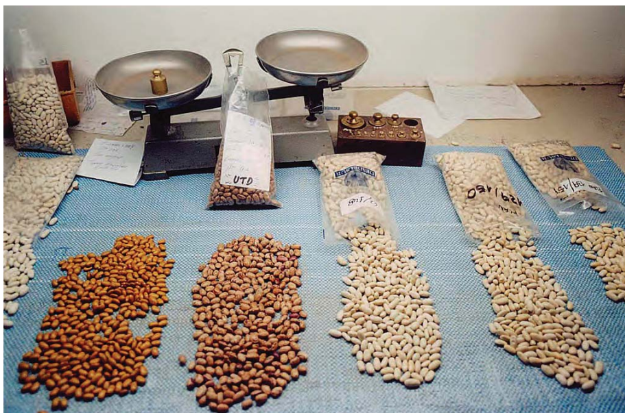
Seleccionadora de porotos. Emprendimiento productivo de la UTD de Mosconi. Salta.