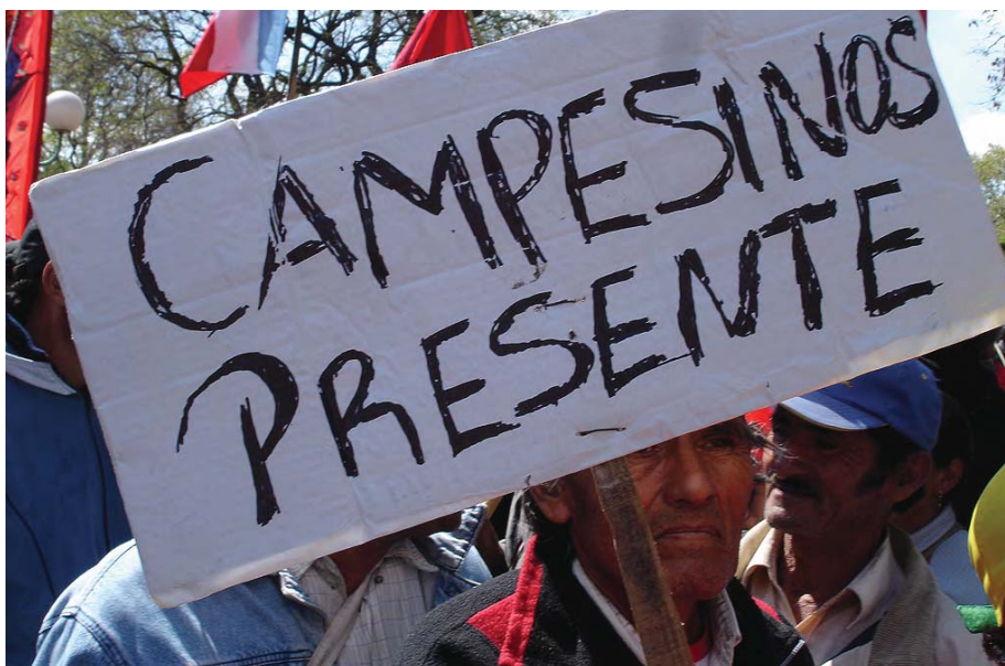
Marcha por la vida, contra el saqueo y la contaminación, Buenos Aires. Foto: Martin Halliburton, 2007.