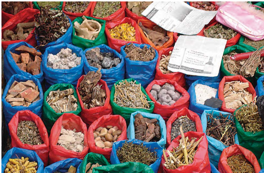
Mercado de Tarija, variedad de legumbres en una economía no formalizada (Bolivia)