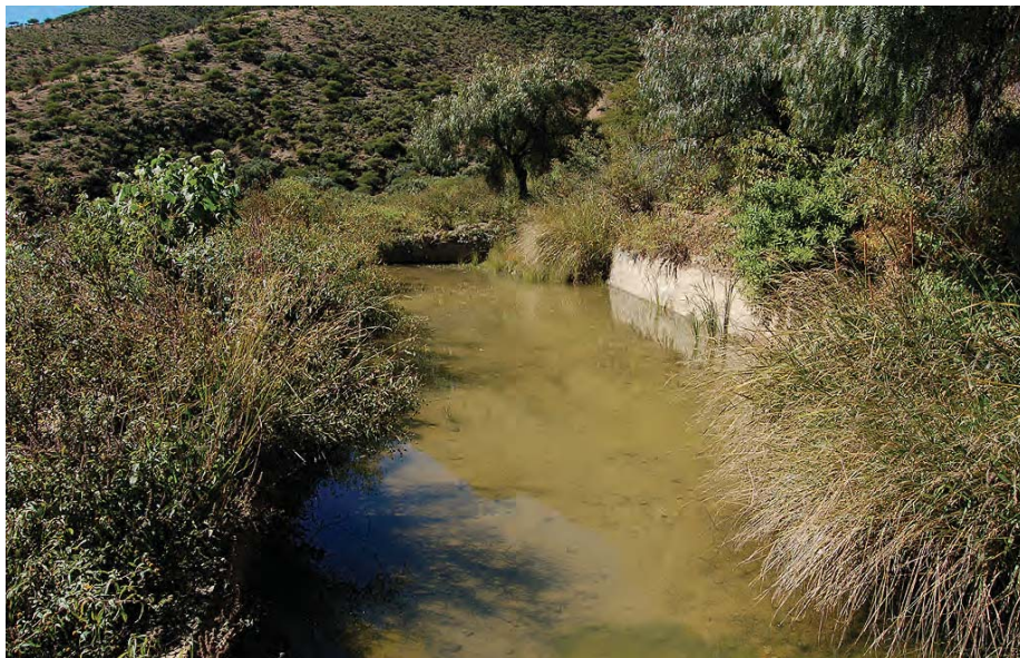
Comunidad campesina de Ladera Norte, cerca de Tarija, Bolivia. Un ejemplo de los varios contenedores de agua de vertiente para riego y consumo. Foto: Douglas Mansour, 2006.