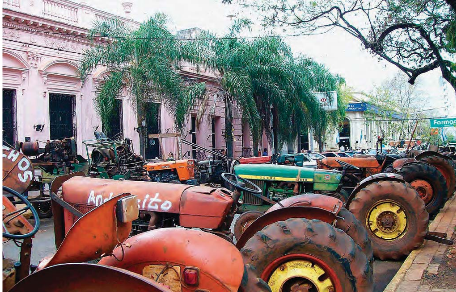
Los productores yerbateros acamparon más de 100 días frente a la Intendencia de Posadas en reclamo de un precio justo para la yerba mate y de la creación del Mercado Consignatario. Plaza 9 de Julio, Posadas, Misiones.