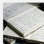
Literature & Language