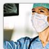
Health & Medicine