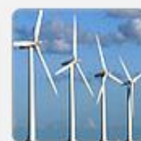
Science & Technology