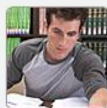
Dissertations & Theses