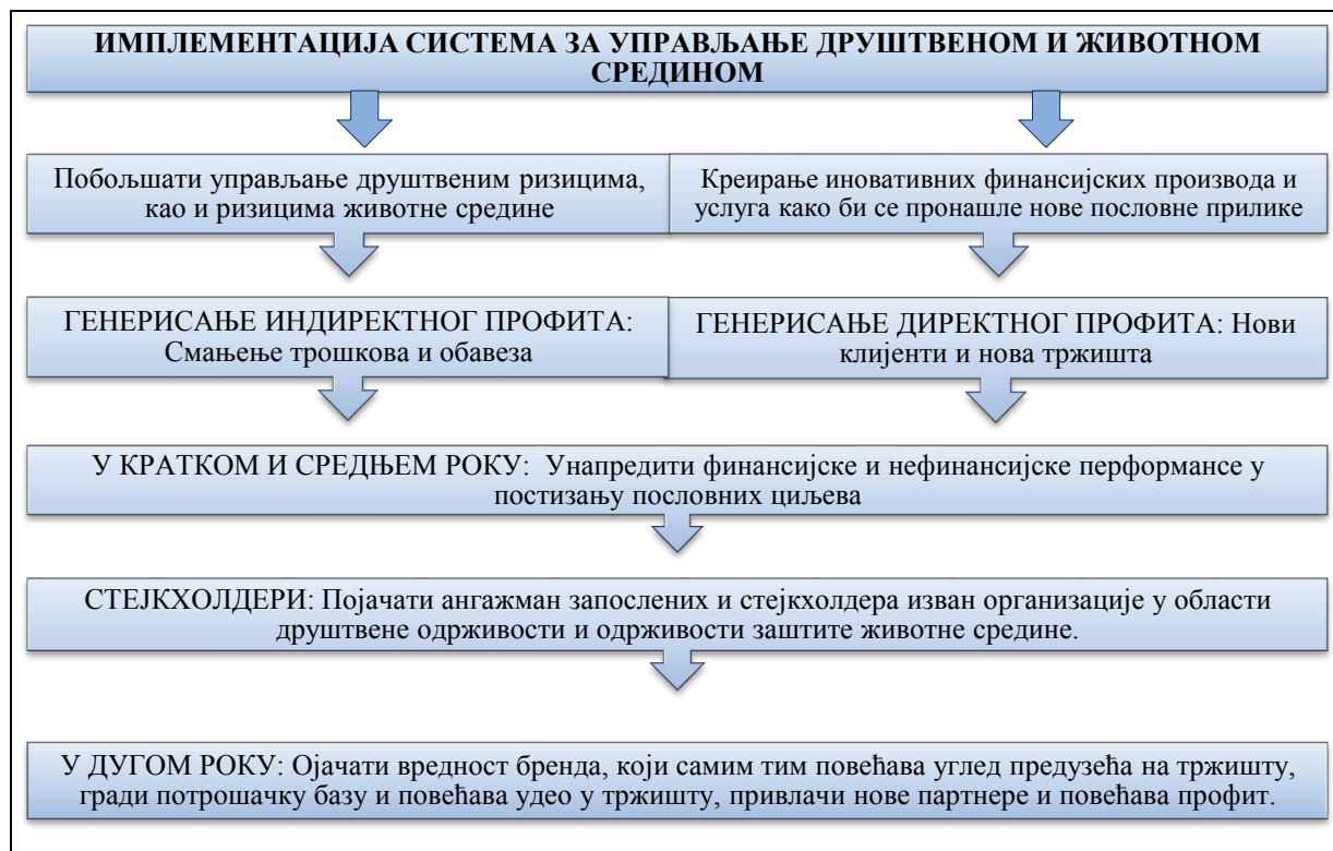
Слика2: Стратегија за стварање дугорочне вредности кроз одрживо банкарство

усвајање стратегије за стварање дугорочне вредности кроз одрживо банкарство, која мора бити осмишљена у складу са пословним циљевима и организационом структуром банке.