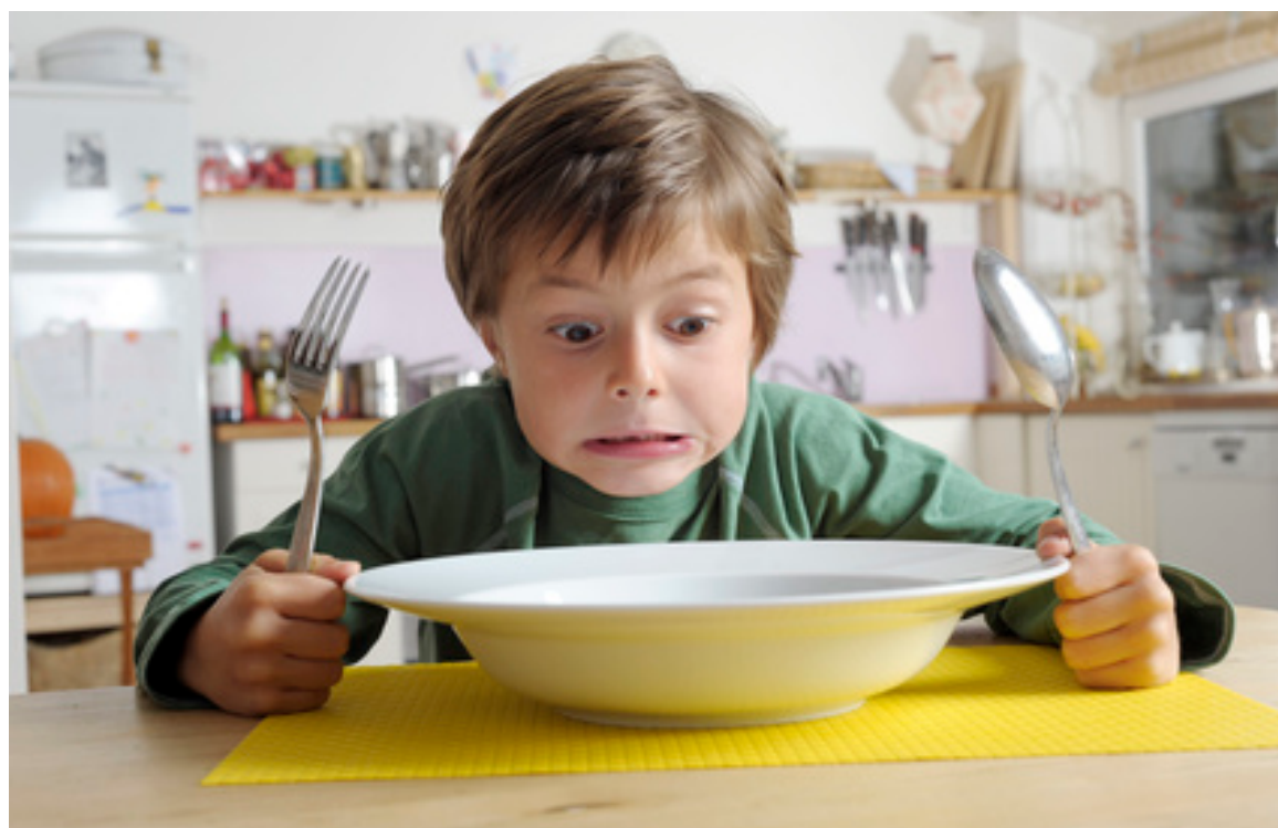
Illustration 1 – Le calvaire des repas

« Pour apprendre à aimer et tenter de guérir un enfant autiste, c'est beaucoup plus simple de l'imaginer comme un Petit Prince. J'apprendrai ton langage. J'entrerai dans ton silence. »