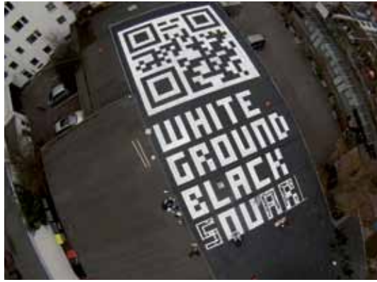
Bitte scannen Sie das Luftbild mit ihrem QR-Code-Reader.