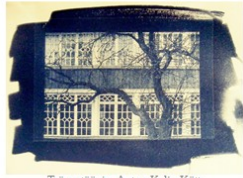
Tsilanotšipia. Autor: Kalju Kütt