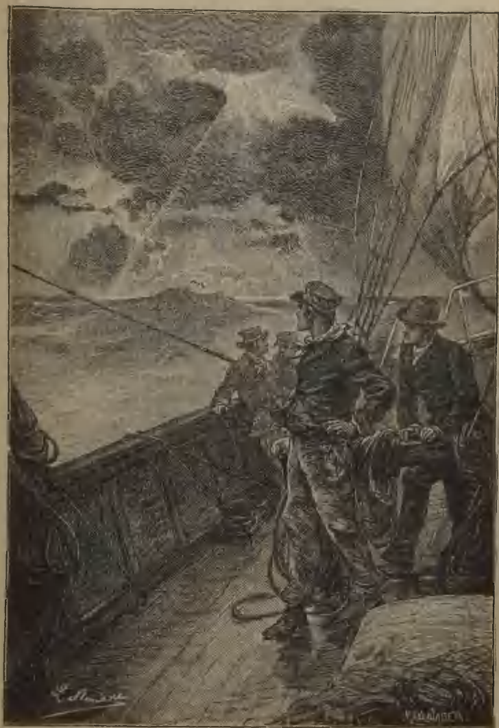
Gravure extraite de Bourses de Voyage , par Jules VERNE.