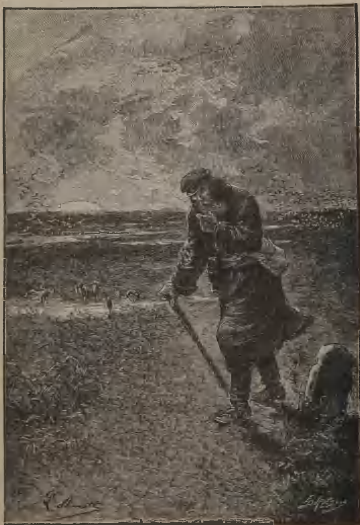
II. A TRAVERSÉ LES STEPPES SIDÉRIENNES. (Page 248.)