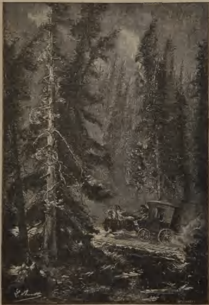
ON LONGEAIT LA LISIÈRE DE VASTES FORÊTS. (Page 77.)