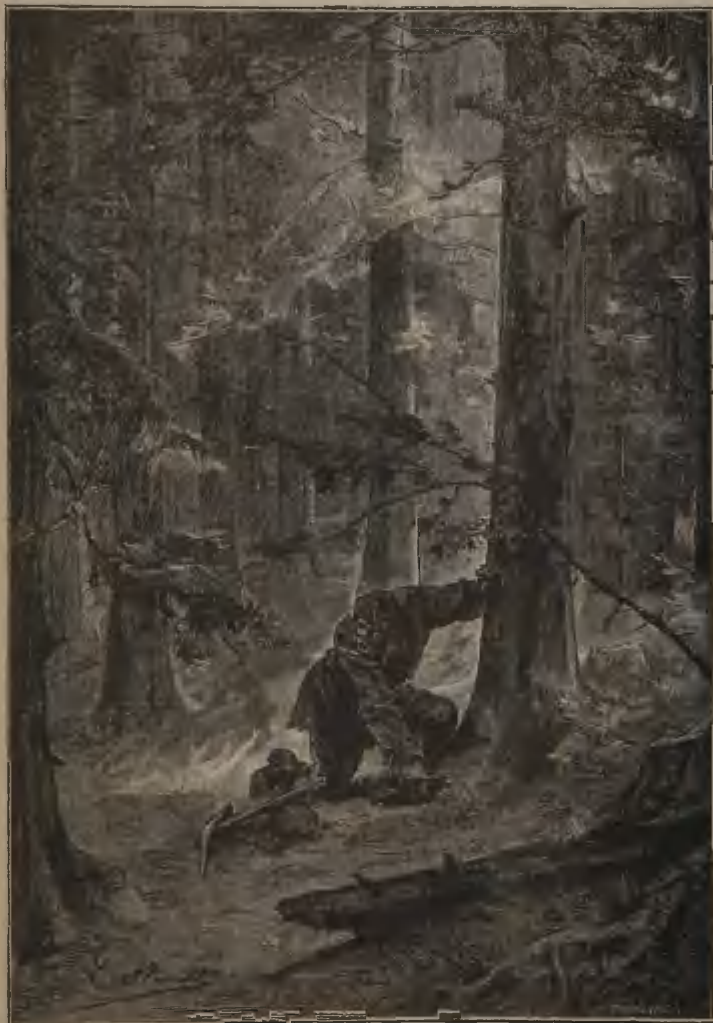
AU PIED D'UN ARBRE IL CACHIA CET ARGENT. (Page 337).