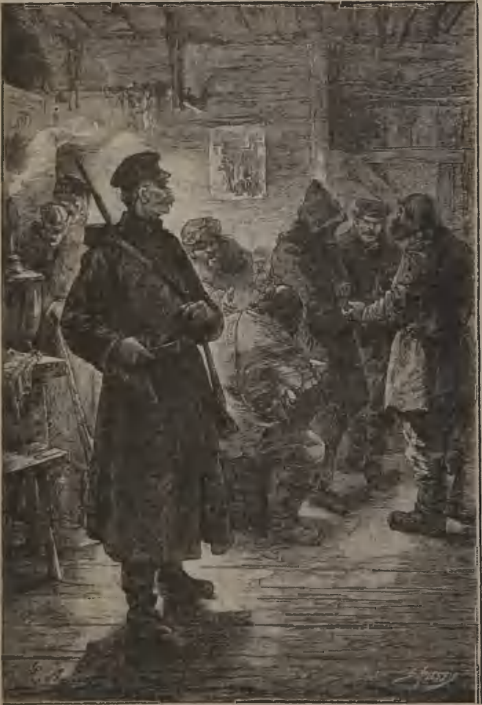
LE BRIGADIER AVAIT PU APERCEVOIR UNE PARTIE DE SON VISAGE. (Page 99.)