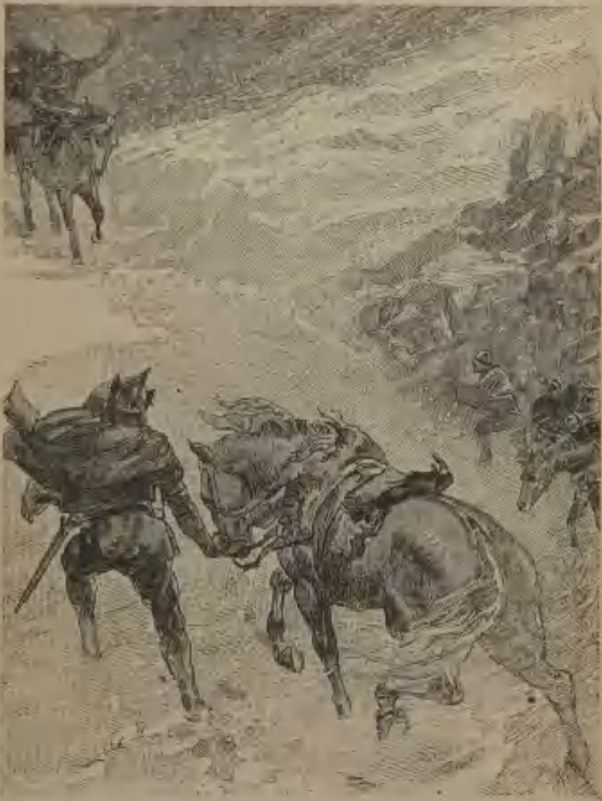
Gravure extraite de l'Anneau de César .