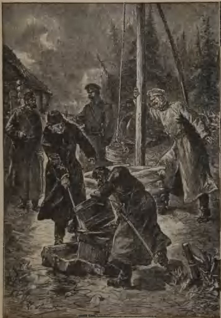
ON EXPLORA LE JARDIN. (Page 278.)