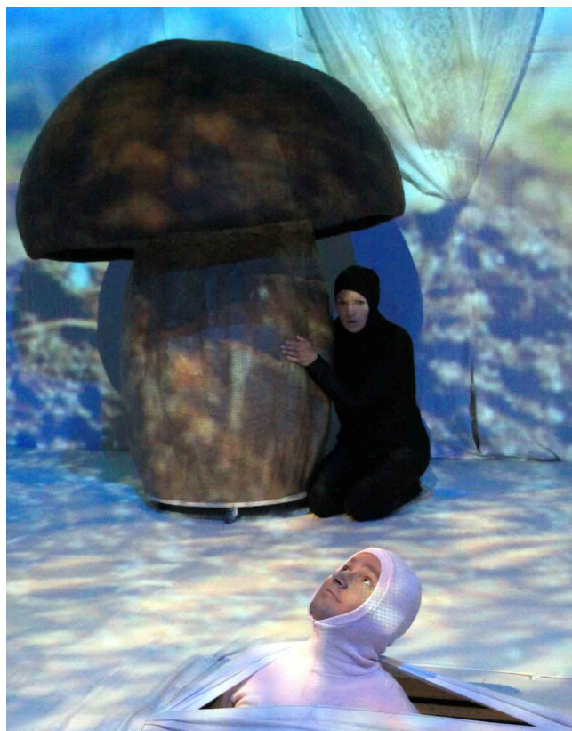
Joonis 7. Sipelgas seene all

Seene kübara karkass oli veidi lopergune metallvõrest poolkera. Karkassi katsin kahesentimeetrise porolooniga. Kuna tegu polnud sümmeetrilise konstruktsiooniga, siis eraldi lõiget seene kübarale ei saanud teha ja katmine toimus karkassi peal otse mõõtes, lõigates ja liimides (liimimisel kasutasin Tixo kontaktliimi). Porolooni katsin trikotaažkangaga, mille mõõtmine toimus samuti otse porolooniga kaetud karkassi peal. Trikotaaž on üks parimaid kangaid, mida selliste tööde puhul kasutada just venimise tõttu, sest kanga venitamisel saab kergelt eemaldada kõik kortsud ja ebatasasused. Kanga õmblesin porolooni peale käsitsi. Käsitsi õmblemine on ka üks aeganõudvamaid töid taoliste suurte dekoratsioonide puhul, kuid ilma lõiketa töötades ja otse karkassi peal mõõtes on see ilmselt ainuvõimalik tehnika.