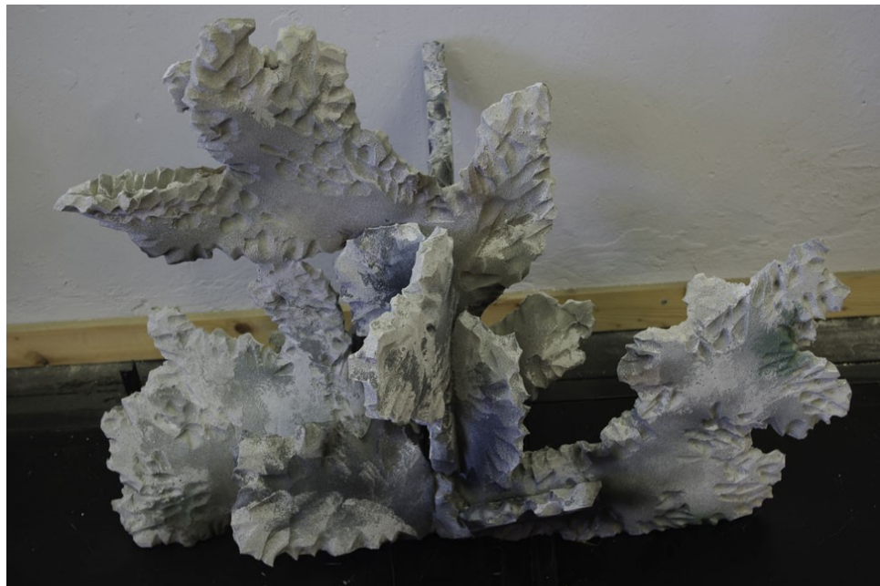
Joonis 13. Valmis samblik

Sambliku jaoks lõikasin kaheksenteetrisest poroloonist välja kaks kihti sobiva kujuga tükke (nö oksakujulisi) ja kääridega lõikasin neisse väikesed tüked, et imiteerida sambliku struktuuri. Siis liimisin kihid (Tixo kontaktliimiga) äärtest omavahel kokku nii, et keskele jäi tühi ruum hoidma