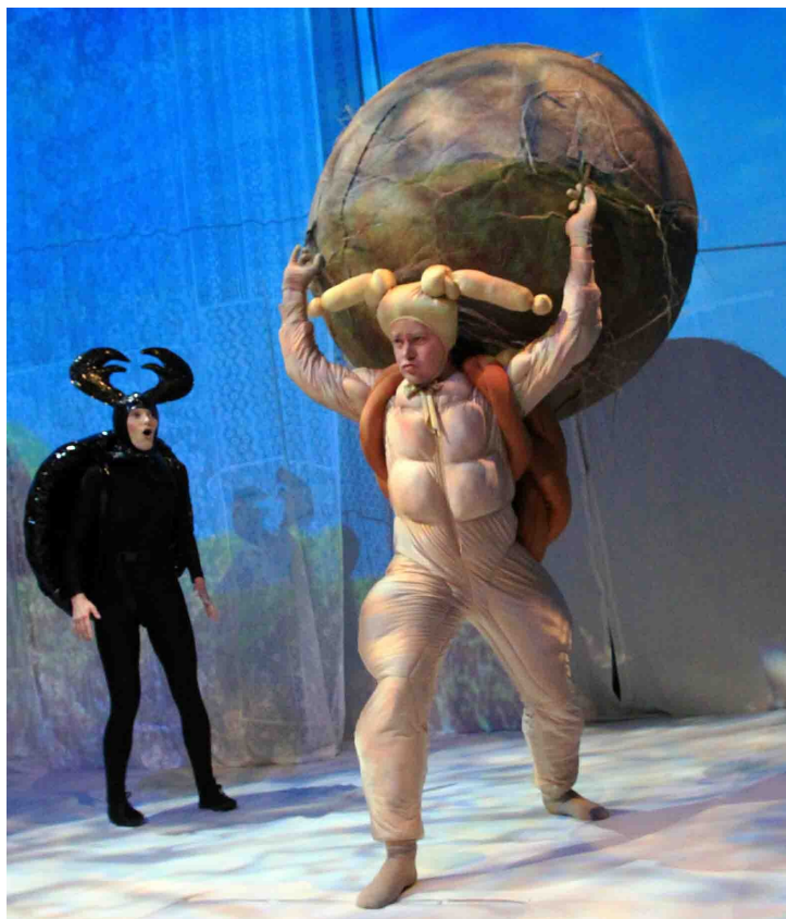
Joonis 9. Tigu sõnnikukuuli tõstmas

Kuna lavastus oli putukatest ja kaks tegelast olid sõnnikumardikad, siis tuli teha sõnnikumardikatele sõnnikukuul. Põhjaks võtsin u ühemeetrise läbimõõduga täispuhutava kummist palli. Välimuselt ja omadustelt sobis parimaks katematerjaliks linavilt, mida märjaks tehes sai venitada palli peale. (Joonis 10.) Kuna tegemist oli rekvisiidiga, mida visati, põrgatati ja veeretati, siis pehme linavilt oli väga hea leid antud rekvisiidi teostamiseks. Palli peale kinnitasin erinevas suuruses linavildist lapid, mis tuli kokku õmmelda käsitsi, sest kuna tegu oli põrgatava palliga, siis liim ei oleks tükke äärtest piisavalt tugevalt koos hoidnud (linavildi näol on tegemist materjaliga, mille kiud on kokku pressitud ja selle tõttu võivad pealmised kiud ja kihid liikumisel liimist lahti tulla) ja otse palli peale linavilti liimida ei saanud, sest soov oli kasutada sama palli hiljem ka mujal. Käsitsi paksu ja märja linavildi õmblemine oli üks raskemaid töid, kuid sel hetkel ei õnnestunud leida paremat võimalust selle töö teostamiseks. Lisaks sai palli peale kinnitatud ka heinakõrvi.