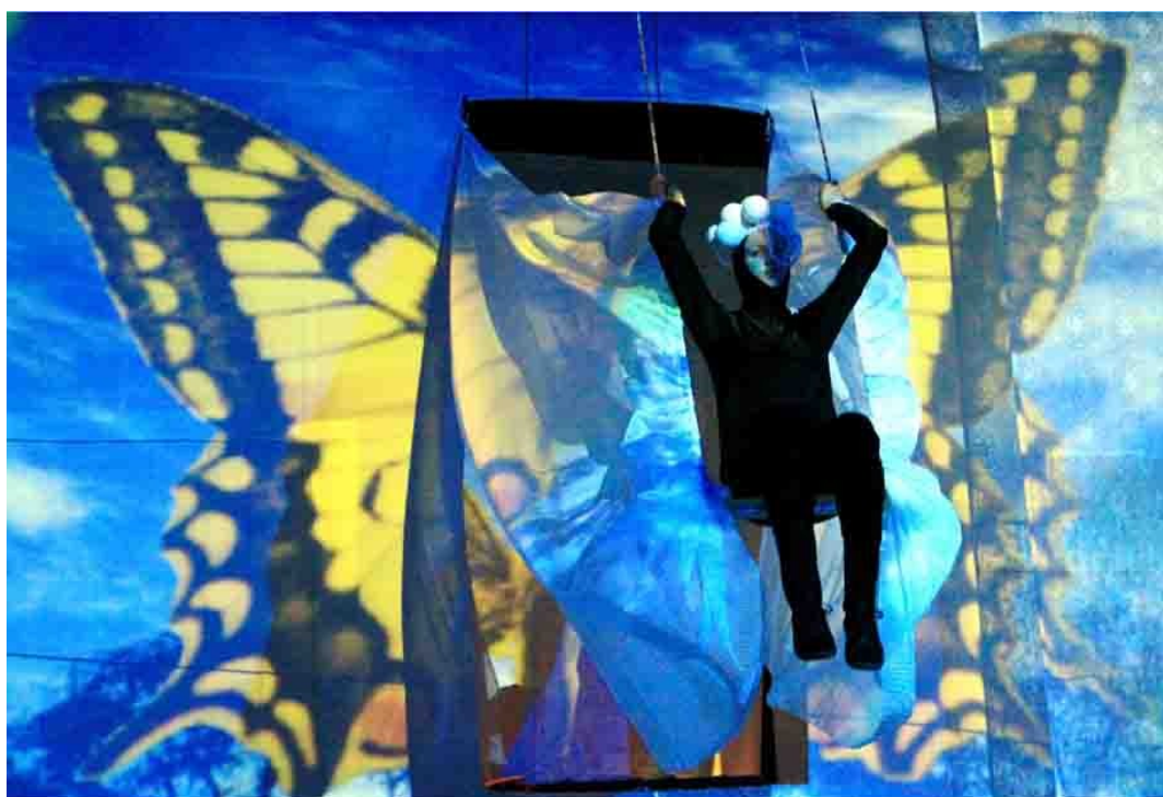
Joonis 3. Liblikas kiikumas projektsiooni taustal

Videoprojektsioonil on antud lavastuse juures tähtis roll, selle jaoks oli saali lavaosa maast laeni kaetud valge kangaga, mille kahele poole ette olid riputatud valged pikad pitskangast kardinad/aksid, lisaks külgedel valged aksid. Ka lavaosa põrand oli kaetud valge kangaga. Valge taust täitis ekraani osa, kuhu projitseeriti video. Kanga sees olid nii tagaseinas kui ka põrandal nõluugid, kus putukad said lavale tulla või lahkuda. (Joonis 2.)