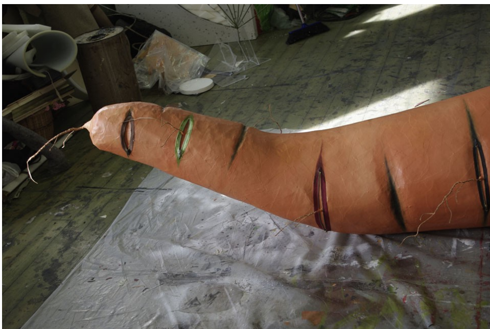
Joonis 12. Tõmblukud porgandil

Tegemist on varem mainitud detailiga, mis vastandab loodust ja tehislisku maailma. Porgandi tagumisele otsale kinnitasin pooleks lõigatud isoleertorudest leherootsud. (Joonis 11.) Kuna isoleertorud on pealt kilejad, siis tuli eelnevalt liivapaberiga üle lihvida, et värv kinnituks paremini. Pikkupidi pooleks lõigatud torud said kinnitatud porgani sisse tehtud auku PVA-liimiga.