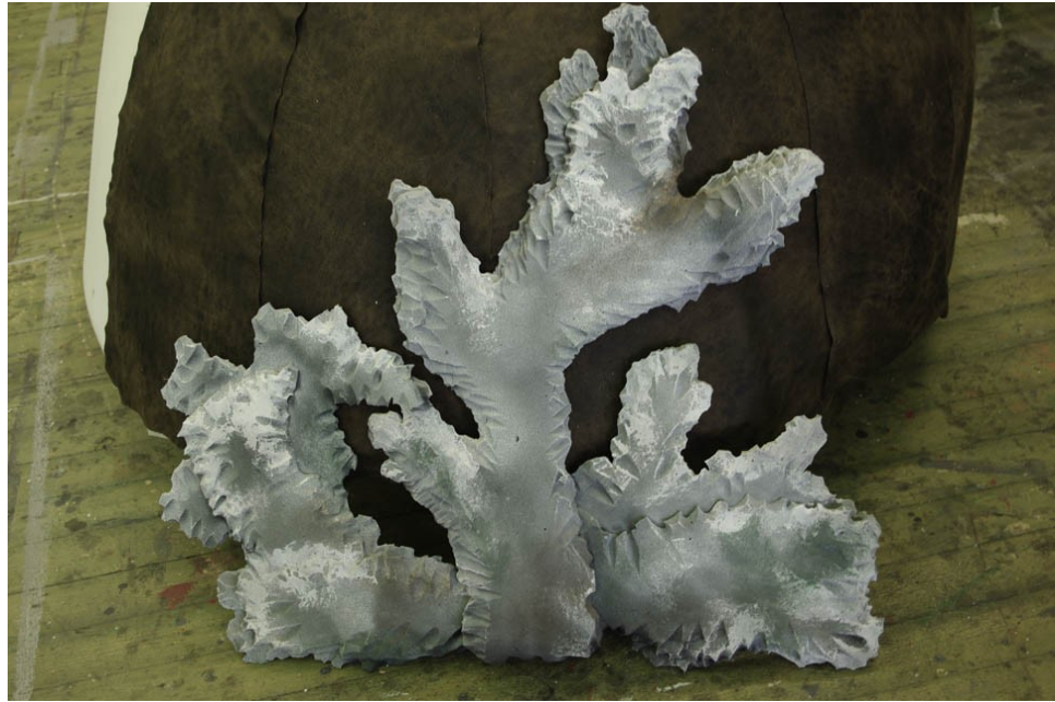
Joonis 13. Pooleli olev samblik