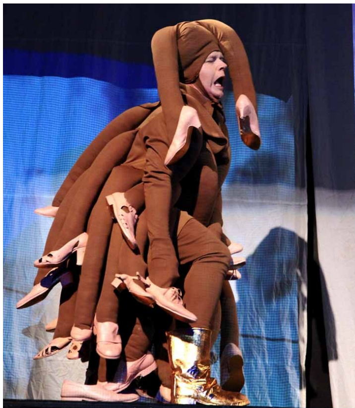
Joonis 6. Sajajalgne uut saabast proovimas

toidab seda mõtet, et kostüümid pole looduslähedased ja näitlejad, kes mängivad putukaid, võivad alguses tunduda võõrad, nagu tulnukad, kuid lähemal vaatamisel võib nende juures näha tuttavaid asju.