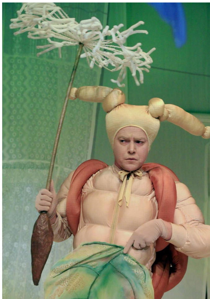
Joonis 4. Tigu hoidmas võililleseemet ja lehte

(Joonis 4.) Näiteks porgandit kasutavad lepatriinud liumäena, seene alla jällegi läheb sipelgas vihma eest peitu. Kõik tegevused, mida rekvisiitidega tehakse on väga lihtsad ja kergesti mõistetavad.