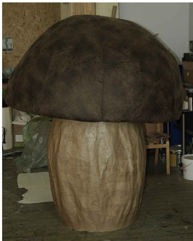
Joonis 8. Seen