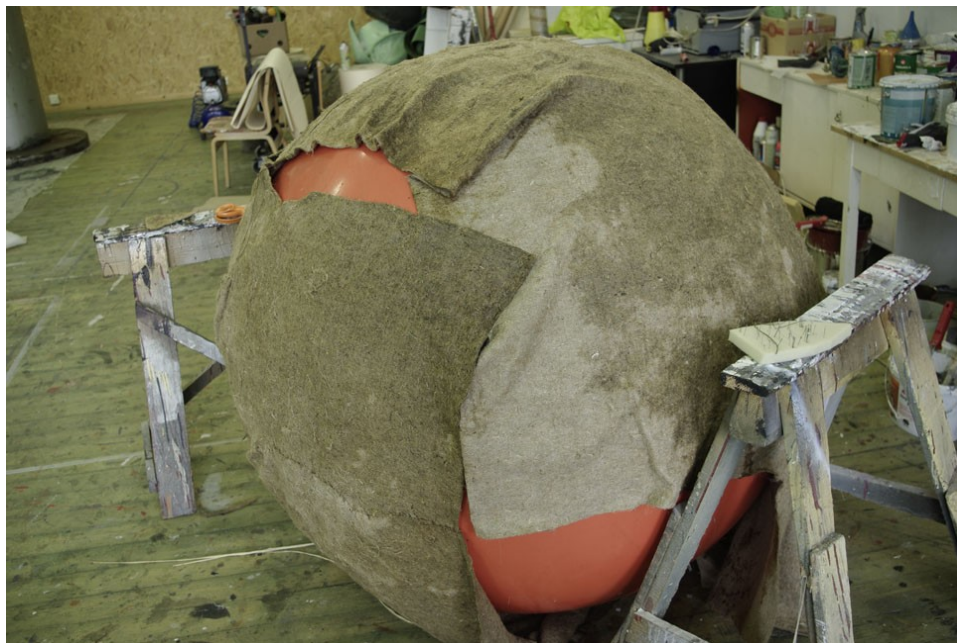
Joonis 10. Sõnnikukuuli katmine linavildiga

Proovide käigus pidas linavildist kate päris hästi vastu, kuid osasid õmblusi pidi vahepeal ka tugevdama. Kuna tegemist on väga suure rekvisiidiga, siis näitlejatel oli raskusi objekti käsitsemisega ja selle tõttu tuli hiljem lisada ka käepidemed (Joonis 9.), et näitlejad saaksid pallist paremini kinni hoida ja sellega mängida.