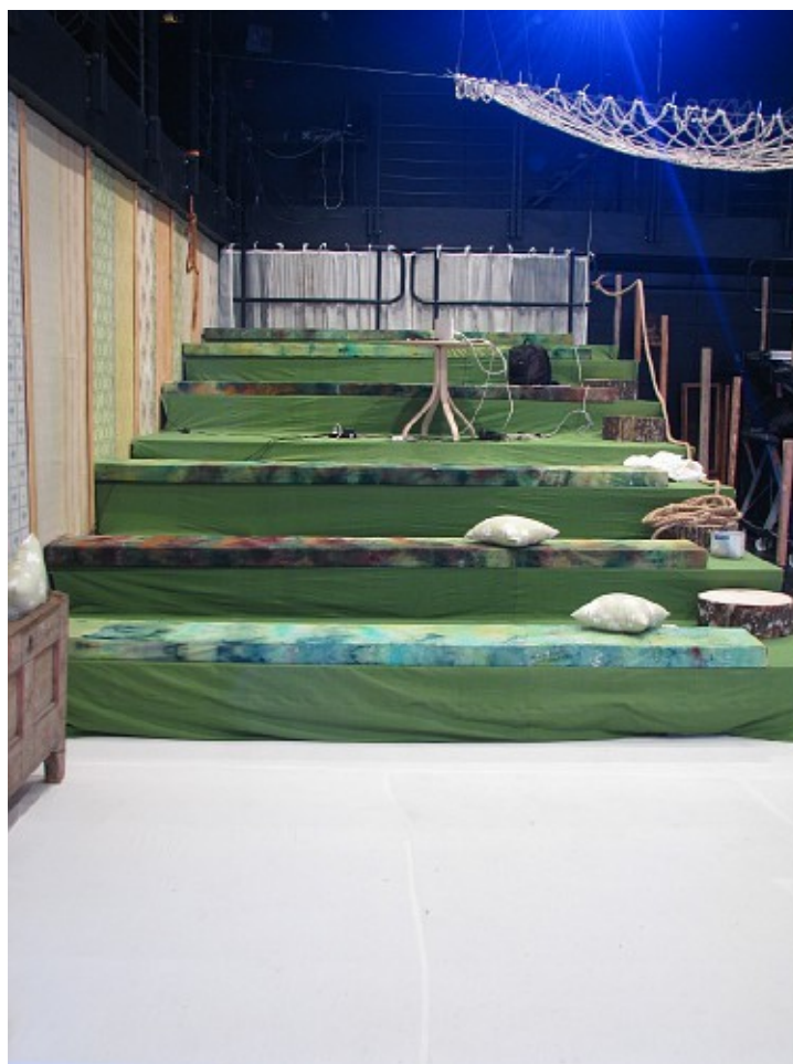
Joonis 1. Vaade lavalt istumiskohtadele

Lavastus leiab aset Endla teatri Kūūnis, mis on black boxi -tüüpi lavaruum. Üheks tähtsamaks osaks lavastuses on see, et lavakujundus haarab endasse terve saali ja publik on haaratud tegevusse. Tihti on kõige nooremale publikule suunatud lavastused samuti publikut kaasavad, kuid need kaasavad lapsi nendega otse suheldes, kuid antud lavastuse puhul on publik toodud lavakujunduse abil loosse sisse. Näitlejad ei suhtle publikuga otseselt ja publik saab neid jälgida kõrvalt nagu ta jälgiks kõrvalt päris putukate toimetamist. Tähtis detail on ka see, et lavastuse ajal on publikul lubatud rääkida (kuna näitlejad suhtlevad vaid hääliksuste kaudu, siis lugu ise kaduma ei lähe), mis annab laste vanematele võimaluse seletada lastele, mis toimub ja samal ajal tõmmates ka vanemad antud loosse (või maailma) sisse.