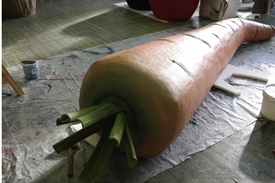
Joonis 11. Porgand

Tegemist on varem mainitud detailiga, mis vastandab loodust ja tehislisku maailma. Porgandi tagumisele otsale kinnitasin pooleks lõigatud isoleertorudest leherootsud. (Joonis 11.) Kuna isoleertorud on pealt kilejad, siis tuli eelnevalt liivapaberiga üle lihvida, et värv kinnituks paremini. Pikkupidi pooleks lõigatud torud said kinnitatud porgani sisse tehtud auku PVA-liimiga.