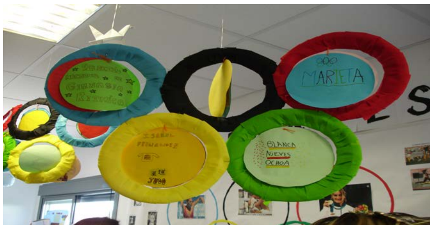
Imagen nº 4. Exposición de trabajos del alumnado de 5º y 6º de Educación Primaria del CEIP San Gabriel de Alicante, realizados con motivo de la Semana Cultural 2016