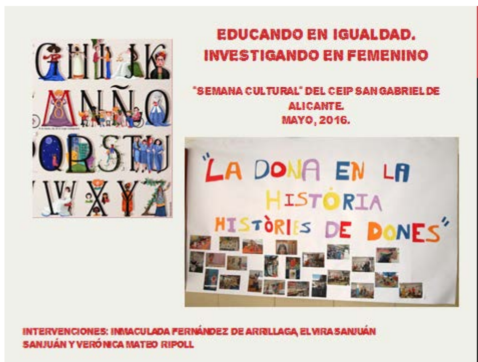
Imagen nº 5. Cartel anunciador de la charla-conferencia del mismo título. Semana Cultural 2016 del CEIP San Gabriel de Alicante