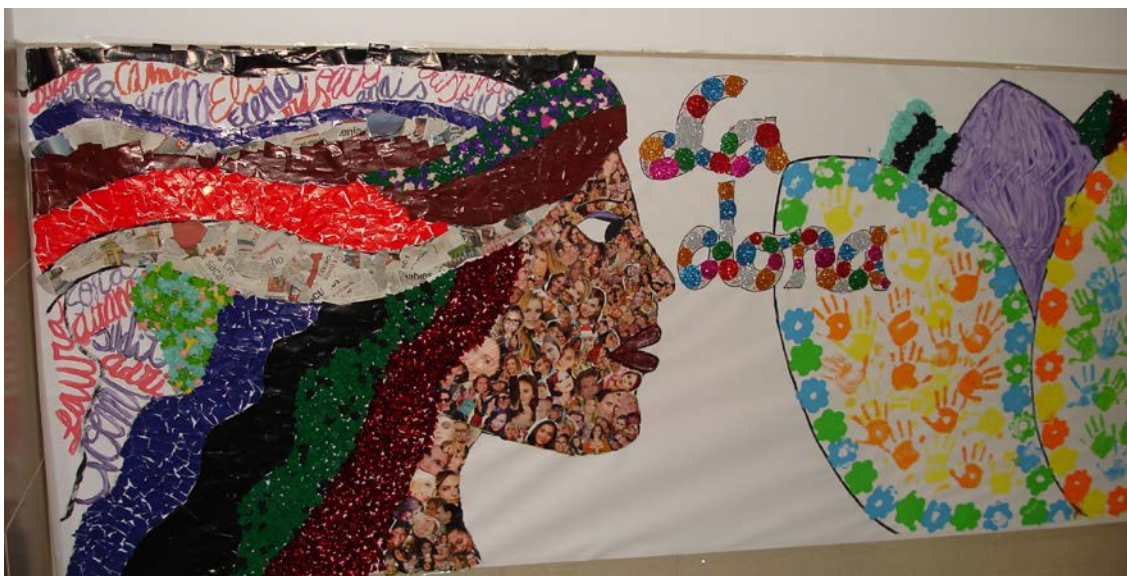
Imagen nº 2. Mural realizado por el alumnado del CEIP San Gabriel con motivo de la Semana Cultural

Por lo que respecta al trabajo docente realizando por todo el equipo educativo durante la Semana Cultural, pasamos a continuación a detallarlo de forma específica, realizando un análisis desde la etapa de Educación Infantil hasta el final de la etapa de Primaria, detallando las tareas realizadas en los diferentes ciclos educativos.