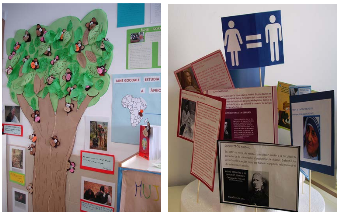
Imagen nº 3. Exposición de trabajos del alumnado de 3º y 4º de Educación Primaria del CEIP San Gabriel de Alicante realizados con motivo de la Semana Cultural 2016

Por último, en esta etapa de infantil se materializaron una serie de actividades comunes para todo el alumnado, entre las que destacamos como factor común la implicación de las familias, lo que enriqueció –por ende-- la relación familia/escuela y la comunicación entre los propios miembros de la misma. Así, se elaboró un árbol genealógico y se invitó a las aulas a generaciones de mujeres de la misma familia para ver las diferencias entre las vidas de cada una, o bien los oficios que ejercieron o que en la actualidad desempeñaban, con la particularidad de que acudieron dos representantes de cada uno de ellos; uno de cada sexo (mujer policía/varón policía; mujer enfermera/varón enfermero, etc.)