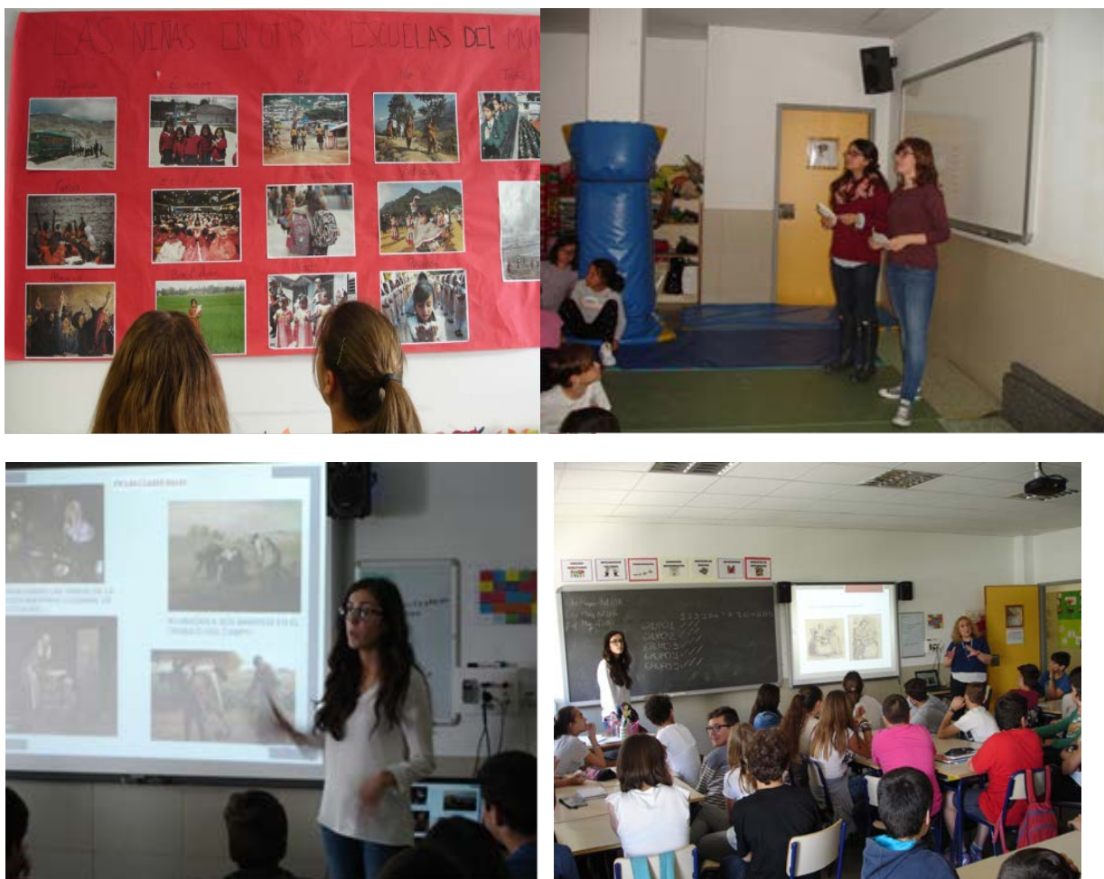
Imagen nº 1. Actividades llevadas a cabo por la Red en el CEIP San Gabriel de Alicante con motivo de la Semana Cultural 2016

Fue creada y adecuada conforme al público que iba a recibirla, niños y niñas de sexto curso de primaria, y consistió en una aproximación al papel que desempeñaron las mujeres como escritoras a lo largo de varios siglos, desde el XVIII hasta la actualidad, para ejemplificar el periplo y las dificultades que sufrieron las mujeres para visibilizar sus trabajos literarios y reivindicar su autoría. Respecto a la metodología, se alternaron las explicaciones con ejercicios que hicieran la exposición más dinámica e interesante para la edad y los conocimientos del público receptor. Por ello, la actividad se desarrolló a modo de juego en el que por grupos los niños debían acertar las preguntas formuladas sobre el tema tratado. Otro de los objetivos inherentes en esta propuesta didáctica era que llegaran a comprender cómo se distribuían las tareas domésticas en esos siglos, y cuáles eran las características que diferenciaban la situación de las mujeres en los distintos grupos sociales.