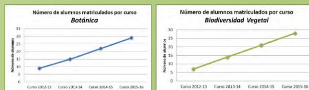
Figura 3. Evolución del número de alumnos matriculados por curso académico en el grupo ARA de Botánica y Biodiversidad vegetal .