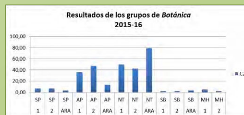
Figura 2. Calificaciones por grupos de la asignatura Botánica en el curso académico 2015-16.