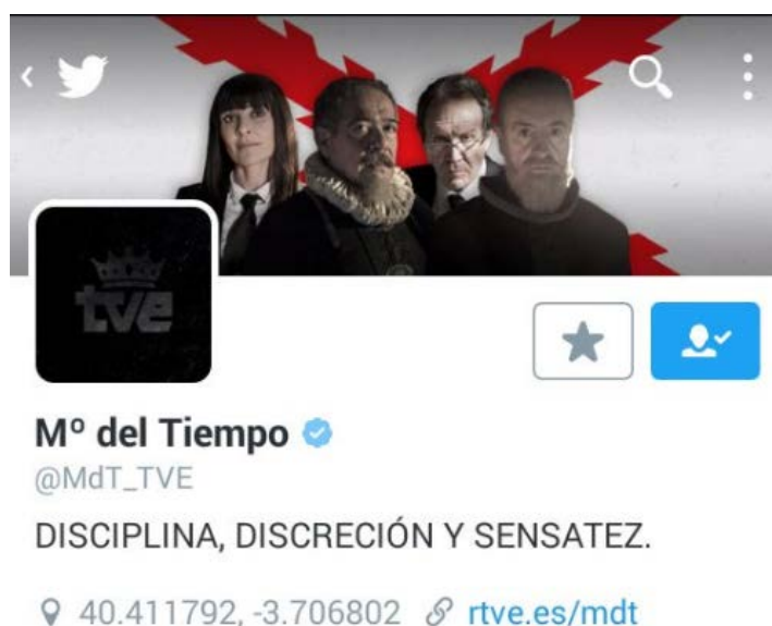
Imagen 2. Perfil de Twitter adaptado para el último capítulo de la 2ª Temporada

También a través del móvil hay campañas más específicas, como el grupo de Whatsapp del Ministerio, donde los espectadores entran por invitación, según preguntas sobre los contenidos de la serie y se les plantean nuevos retos http://www.rtve.es/television/20160127/grupo-whatsapp-ministerio-del-tiempo-segunda-temporada/1291164.shtml .