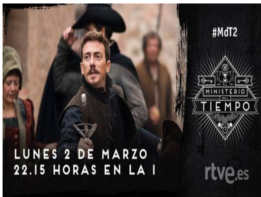
Figura 1. Publicidad de la segunda temporada

Es cierto que muchos de estos relatos audiovisuales se basan en buscar el éxito comercial y en agradar al máximo número de espectadores, muchas veces sin grandes expectativas artísticas. Pero también hay series que muestran una calidad excepcional y pueden ser interpretados en múltiples niveles y ofrecen alicientes tanto a adolescentes, espectadores y lectores en formación como a personas adultas con una rica competencia literaria. Este es el caso de El Ministerio del Tiempo , que ha despertado el interés entre espectadores jóvenes, que aprenden muchas cosas con sus capítulos, y espectadores adultos que disfrutan identificando las múltiples referencias históricas y literarias.