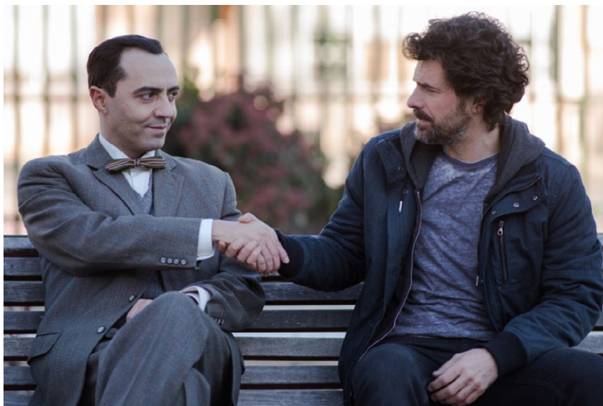
Figura 2. Julián, uno de los protagonistas, con Federico García Lorca. Capítulo 8. Primera Temporada

contenida buena parte de la cultura y la tradición del mundo, porque son modelos de la escritura literaria”, (Cerrillo, 2007:67).