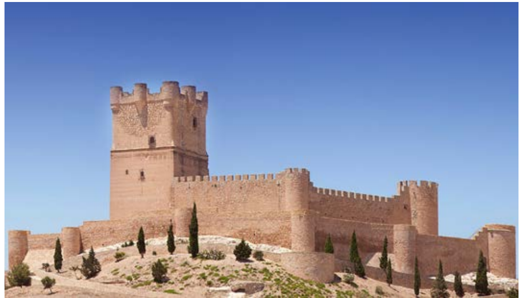
Castillo de la Atalaya (Villena).

finales no han pasado de la edición de material promocional e informativo. La creación, la ejecución, la implantación y la gestión de esta ruta constituye una estrategia de acción pendiente y que, sin embargo, ofrece enormes posibilidades de éxito, siempre que se conciba, se desarrolle y se gestione como un verdadero producto turístico (Rico y Navalón, 2011).