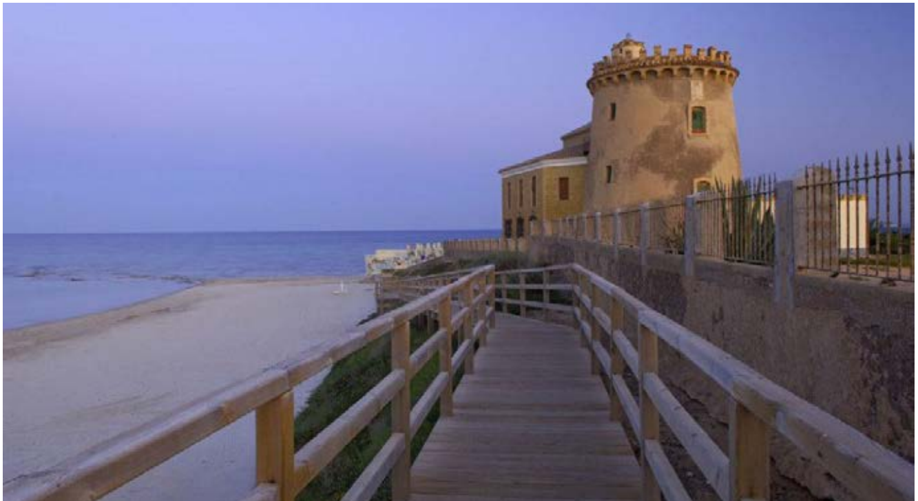
Genihilibus aut que venesci psandunt. Vit earum excerate omnis eosam experfe rspicim olorpporunt.

la muestra del grado de atractivo turístico que tienen estos elementos patrimoniales intangibles en la localidad donde tienen lugar. Como se muestra en la tabla 4 (ver en el anexo), los elementos intangibles declarados BIC por la normativa autonómica como rituales festivos son Les Fogueres de Sant Joan (Alacant), el Betlem de Tirisiti y Cavalcada dels Reis Mags (Alcoi), el Misteri (Elx), y el Ritual del Pa Beneit (Torre de les Maçanes). El caso del Centre de Cultura Tradicional de Pusol se incluye en la categoría de oficios y saberes tradicionales. Algunos de ellos al mismo tiempo, tienen su correspondiente declaración como Fiesta de Interés Turístico Internacional. El resto de elementos de la tabla corresponden a las FITN y las FITI, fundamentalmente centradas en celebraciones históricas (Moros y Cristianos, Hispano-Árabes), religiosas (Semana Santa, Procesión del Domingo de Ramos, La Pasión) y tradición musical (Certamen Internacional de Habaneras y Polifonía).