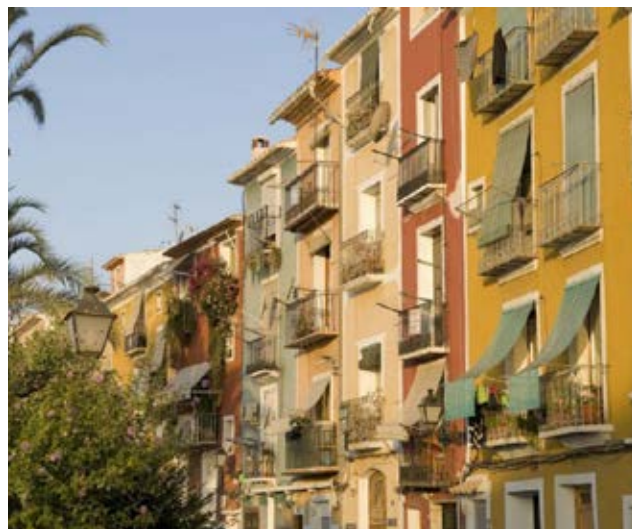
Genihilibus aut que venesci psandunt. Vit earum excerate omnis eosam experfe rspicim olorporrunt.

arqueológico alicantino a través de la musealización de algunos de los principales yacimientos arqueológicos de la provincia: Tossal de Manises (abierto al público en 1998), la Illeta dels Banyets, la Pobla Medieval de Ifach (Calp), la Cova de l'Or (Beniarrés) y el santuario neolítico del Pla de Petracos (Castell de Castells). Además, en los dos últimos casos, se han creado equipamientos interpretativos para mejorar la comprensión y el uso social de ambos elementos que, por las particularidades de sus localizaciones y su grado de fragilidad, requieren este tipo de soluciones.