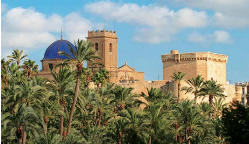
Palacio de Altamira, Basílica de Santa María y Palmaral (Elx).

siglo XVI, con modificaciones posteriores. Es el icono histórico y turístico más importante de la ciudad de Alacant, que actúa como imagen turística de este destino.