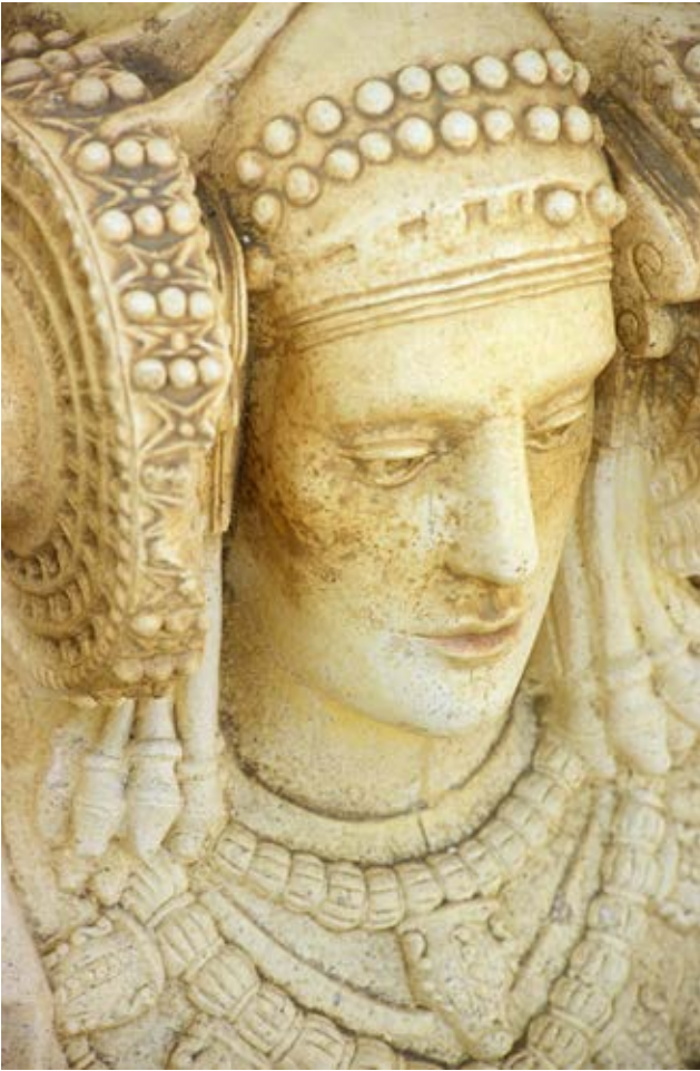
Genihilibus aut que venesci psandunt. Vit earum excerate omnis eosam experfe rspicim olorpporunt.

evidentemente en el caso de la Costa Blanca, presenta las características que identifican a un destino turístico tradicional basado en el producto de sol y playa.