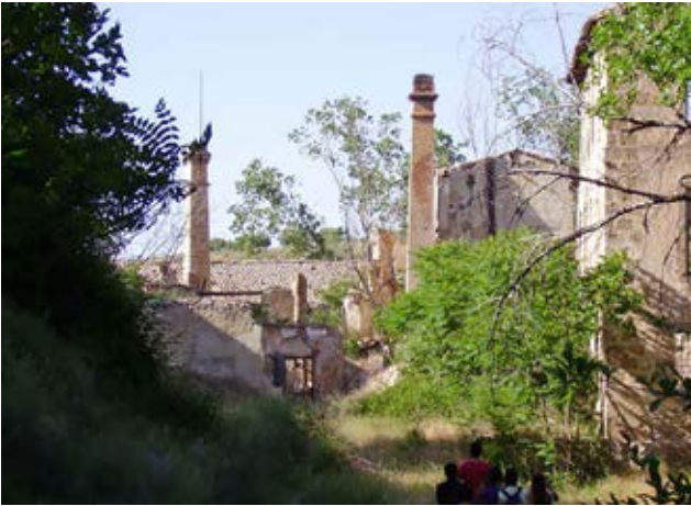
El Molinar (Alcoi).

industriales que surgen con el proceso industrializador que tiene lugar en el siglo XIX y principios del XX, en los núcleos de Alcoi (El Molinar) y Banyeres de Mariola (Ruta de los Molinos de Papel). Este hecho generó paisajes y elementos patrimoniales tan interesantes como los señalados, que podrían constituir un argumento sólido para la creación de un producto de turismo industrial.