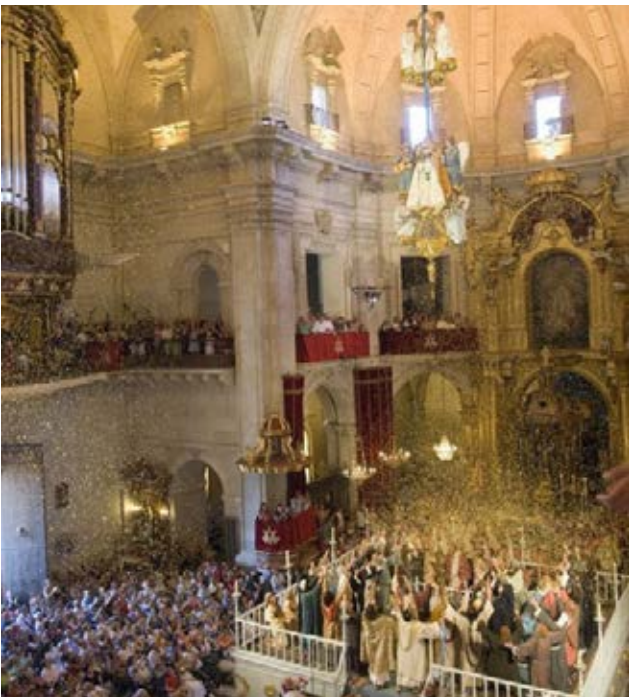
Genihilibus aut que venesci psandunt. Vit earum excerate omnis eosam experfe rspicim olorpporunt.

A este atractivo patrimonial hay que añadir algunas iniciativas asociadas al desarrollo del turismo industrial que surgen en empresas que actualmente se encuentran en funcionamiento o también denominadas, industria viva (Pardo, 2011). En este sentido, existen otras temáticas industriales que también pueden resultar interesantes, como la industria del calzado (valle del Vinalopó), la industria alfarera (Agost), la industria del juguete (Foia de Castalla) y las relacionadas con la producción de alimentos como el turrón en Xixona, el chocolate en La Vila Joiosa, la