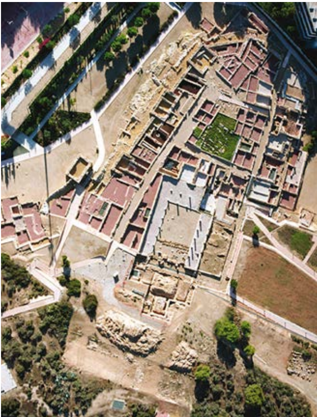
Yacimiento arqueológico de Lucentum (Alicante).

Se introduce así otro de los temas patrimoniales de enorme potencial turístico para la provincia de Alicante, que se basaría en el amplio conjunto patrimonial arqueológico existente. Con ánimo de síntesis, en la tabla 2 (ver en el anexo) se ofrece información sobre las principales zonas arqueológicas declaradas BIC en el contexto provincial. Como en los casos anteriores, la existencia de zonas arqueológicas declaradas BIC no es garantía de su uso turístico y recreativo. Estos elementos, debido a sus características formales (Querol y Díaz, 1996) requieren de enormes esfuerzos de preparación y presentación al público para lograr su lectura y comprensión, de ahí que sea especialmente necesaria la presencia de soportes y recursos de información e interpretación así como que los yacimientos con vocación turística hayan sido objeto de cierto grado de musealización. Por ello, dentro de las zonas arqueológicas señaladas, es oportuno identificar aquéllas que, en la actualidad, podrían constituir el germen de un producto de turismo arqueológico en la provincia de Alicante (Tresserras, 2008). En este sentido es oportuno señalar la magnífica labor que realiza el MARQ (Museo Arqueológico Provincial de Alicante) en la difusión social del patrimonio