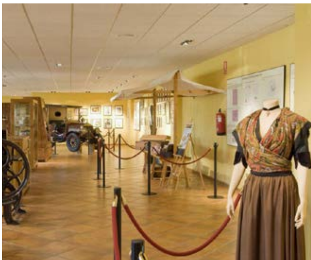
Genihilibus aut que venesci psandunt. Vit earum excerate omnis eosam experfe rspicim olorporrunt.