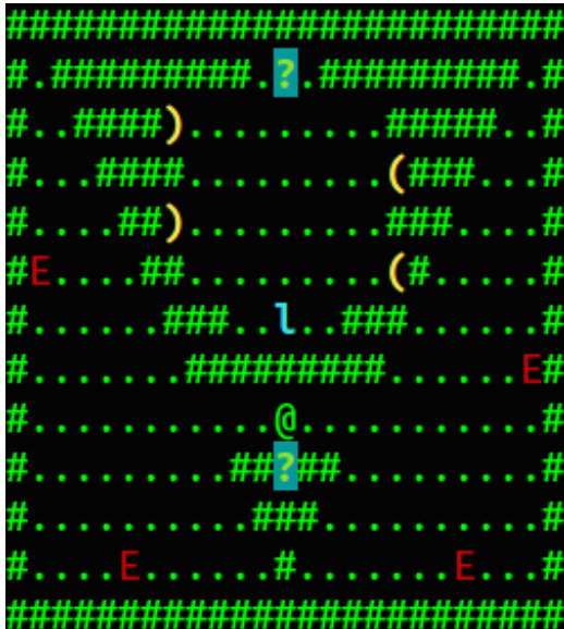
Figura 1. Ejemplo de mapa de PLMan

Todas estas innovaciones se pueden catalogar como clásicas: adaptación de temarios, utilización de los juegos, incorporación de las tecnologías de la información al proceso docente, búsqueda de herramientas informáticas específicas para el aprendizaje de la materia y diseño de nuevas herramientas, y realización de actividades lúdicas complementarias a las clases. Y pese a representar mejoras en la docencia, seguían sin satisfacerlos del todo. Se había conseguido una mayor motivación de los estudiantes al diseñar actividades más divertidas, que permitían y favorecerían la creatividad y la proactividad, que los estudiantes percibían como útiles y había aumentado su participación. Pero la asignatura seguía padeciendo algunos de los problemas que caracterizan las innovaciones docentes: más trabajo para el profesor y mucho más tiempo para la corrección, lo que proporcionaba a los estudiantes un feedback lento y representaba una sobrecarga evaluativa, de difícil escalabilidad y con un alto coste de mantenimiento.