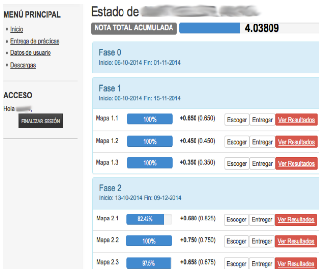
Figura 3. Web de soporte al sistema PLMan