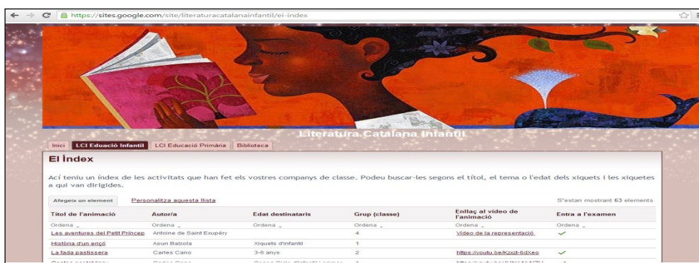
Imatge 3. Site de Google Literatura Catalana Infantil

Per a reunir aquest valuós material i posar-lo a l'abast de l'aula, hem creat una pàgina web amb Google Sites, i això sense tenir coneixements del llenguatge html. El resultat està disponible en l'adreça https://sites.google.com/site/literaturacatalanainfantil/ , que recull les dos assignatures de la Facultat d'Educació que treballen la literatura catalana infantil. En l'índex de l'assignatura d'Educació Infantil, es pot observar una distribució que agrupa els treballs de l'alumnat segons l'autor que treballen, l'edat dels xiquets als quals va dirigida l'animació lectora, l'adreça de Youtube on es pot consultar l'enregistrament de l'activitat i dades relacionades amb el grup de classe (vegeu Imatge 3).