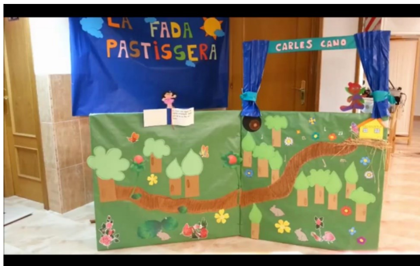
Imatge 2. Vídeo de Youtube sobre "La fada Pastissera"