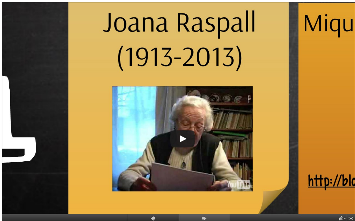
Imatge 8. Detall d'una presentació sobre narrativa juvenil, amb un fragment cinematogràfic incrustat (autores: Isabel Marcillas, Llúcia Martín, Irene Mira)