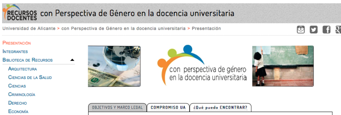
Figura 1. Logo y página principal con menú de contenidos del “Portal web de recursos docentes con perspectiva de género para la docencia universitaria” (UA)

La función principal del portal de recursos docentes universitarios con perspectiva de género es contener un catálogo de recursos de libre disposición (Berná, Rodríguez y Maciá, 2014). Los diferentes recursos están clasificados por