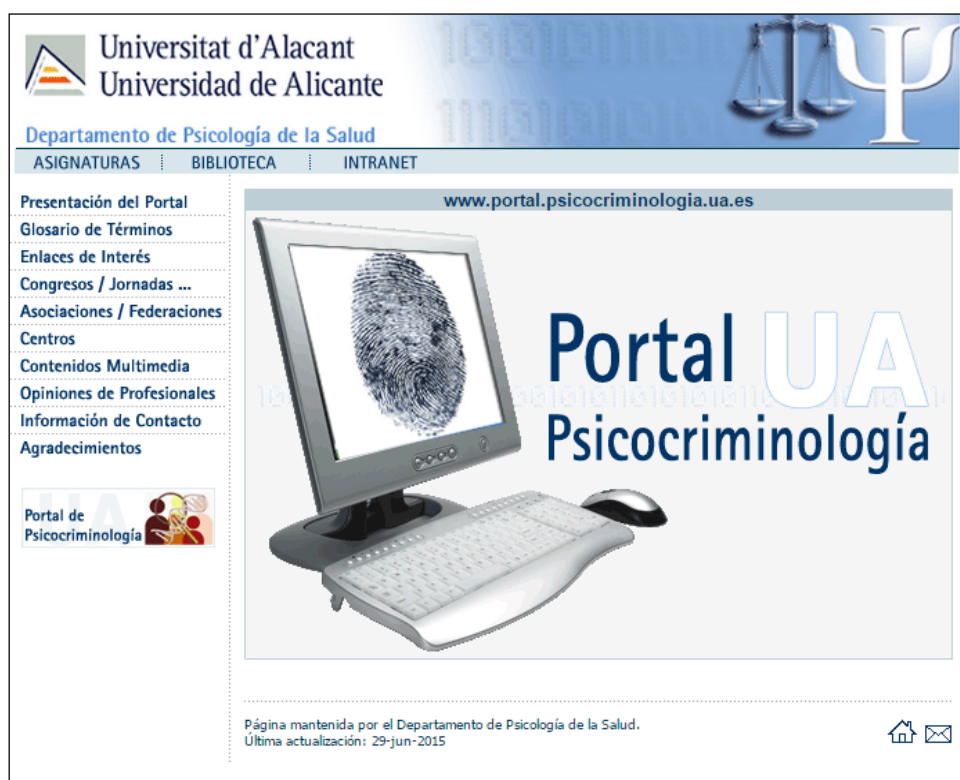
Figura 2. Web de Portal de Psicocriminología de la Unviersidad de Alicante