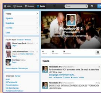
Fig. 5. Red Social Twitter