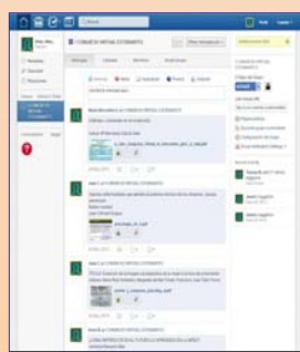
Fig. 3. Red Social Edmodo