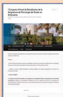
Fig. 2. Blog UA. Congreso Virtual

El 90% de los estudiantes de nuestro estudio consideran que las redes sociales fomentan la participación, el trabajo en equipo y el intercambio de experiencias entre profesorado-alumnado. En relación a la percepción que tienen los estudiantes sobre la utilidad académica o profesional que tiene el uso de las redes sociales, el 85% valora como relevante su utilización y más del 80% considera que les han facilitado la realización de las actividades programadas en la asignatura y suponen un buen recurso de aprendizaje y de adquisición de competencias de las mismas.