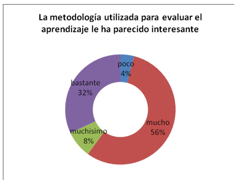
Figura 1. Opinión de los alumnos sobre la metodología utilizada para evaluar el aprendizaje

En relación con los recursos metodológicos empleados, se formuló a los alumnos de la asignatura de Seguridad e Higiene Industrial de la titulación de Ingeniero Químico de la Universidad de Alicante la pregunta: “¿La metodología para evaluar el aprendizaje en los temas de Higiene Industrial de la asignatura le ha parecido interesante?”. Los resultados obtenidos sobre adquisición de competencias (valores en porcentaje) se presentan en la figura 1.