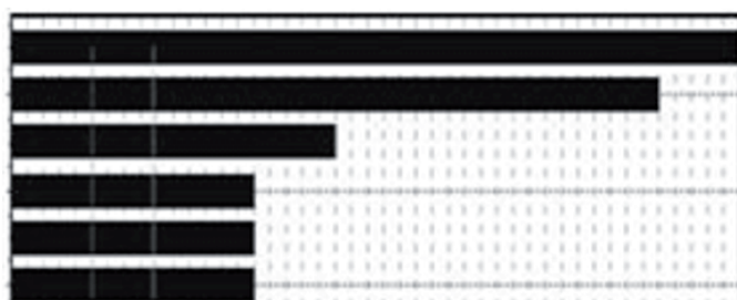
Figura 2. Frecuencias de las acciones motrices realizadas en los programas de Actividad Física.

todas las acciones motrices realizadas por el conjunto de participantes. La figura 2 muestra las frecuencias de los patrones motrices de los que podemos comprobar que el denominador común es el trabajo psicomotor individual (psy) de carácter utilitario (u) realizadas en circularidad en el espacio (cir) y con todo el grupo a la vez (mac). A partir de aquí esta configuración se acompaña de las variaciones siguientes: en 25 situaciones se realizan acciones motrices de locomoción (l) que implican desplazamiento conjuntamente con coordinación segmentaria (lic) de brazos y piernas; en 21 situaciones interactúan en grupo (gi), con acciones motrices de locomoción (l) y flexibilidad (stch); en 14 situaciones realizan la misma configuración anterior per la coordinación es fina (fic); en 12 situaciones realizan locomoción (l) con coordinación segmentaria (lic) y acciones con cierta velocidad de reacción (rs); en otras 12 situaciones la locomoción se hace conjuntamente con la manipulación (lm) con coordinación segmentaria (lic) y flexibilidad (stch) y en otras 12 situaciones la locomoción la combinan con estabilidad (sl) con coordinación segmentaria (lic) y flexibilidad (stch).