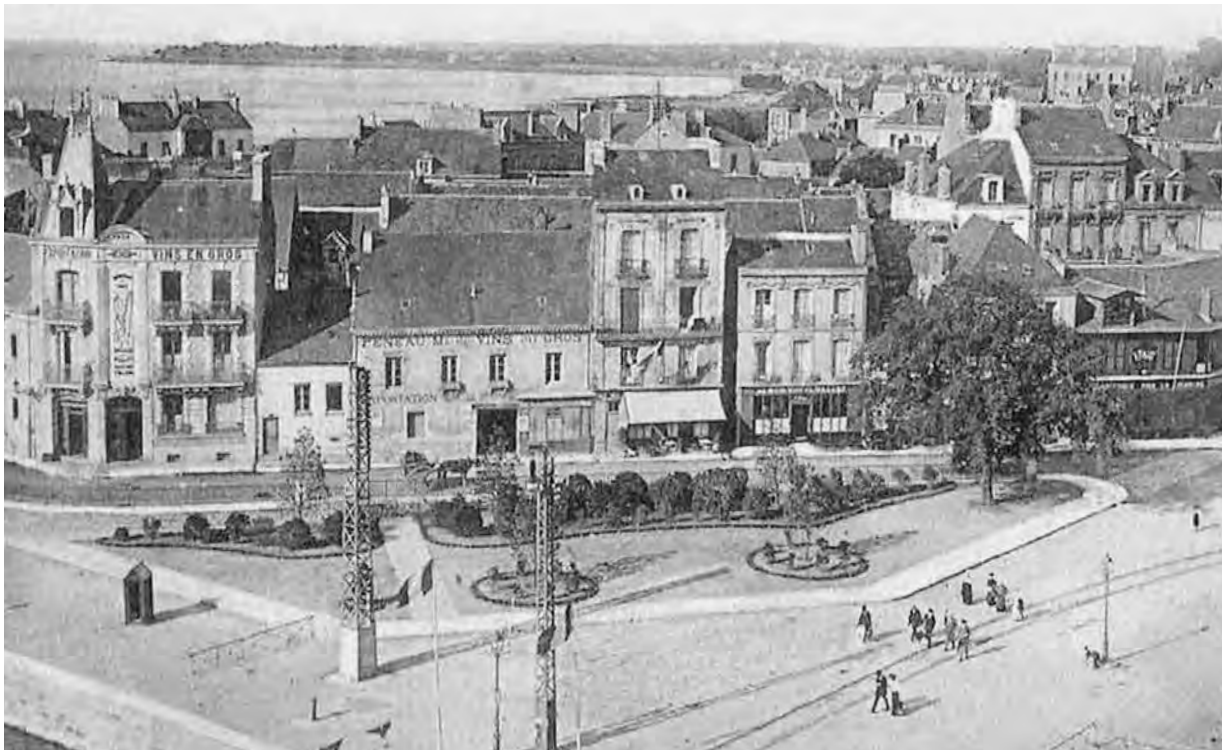
Saint-Nazaire (Loire Atlàntica), al principi del segle XX

bé, només vuit mesos després de la seva arribada a França, esclatava la Primera Guerra Mundial. Allà, però, per la seva condició d'estranger degué poder estalviar-se la mobilització.