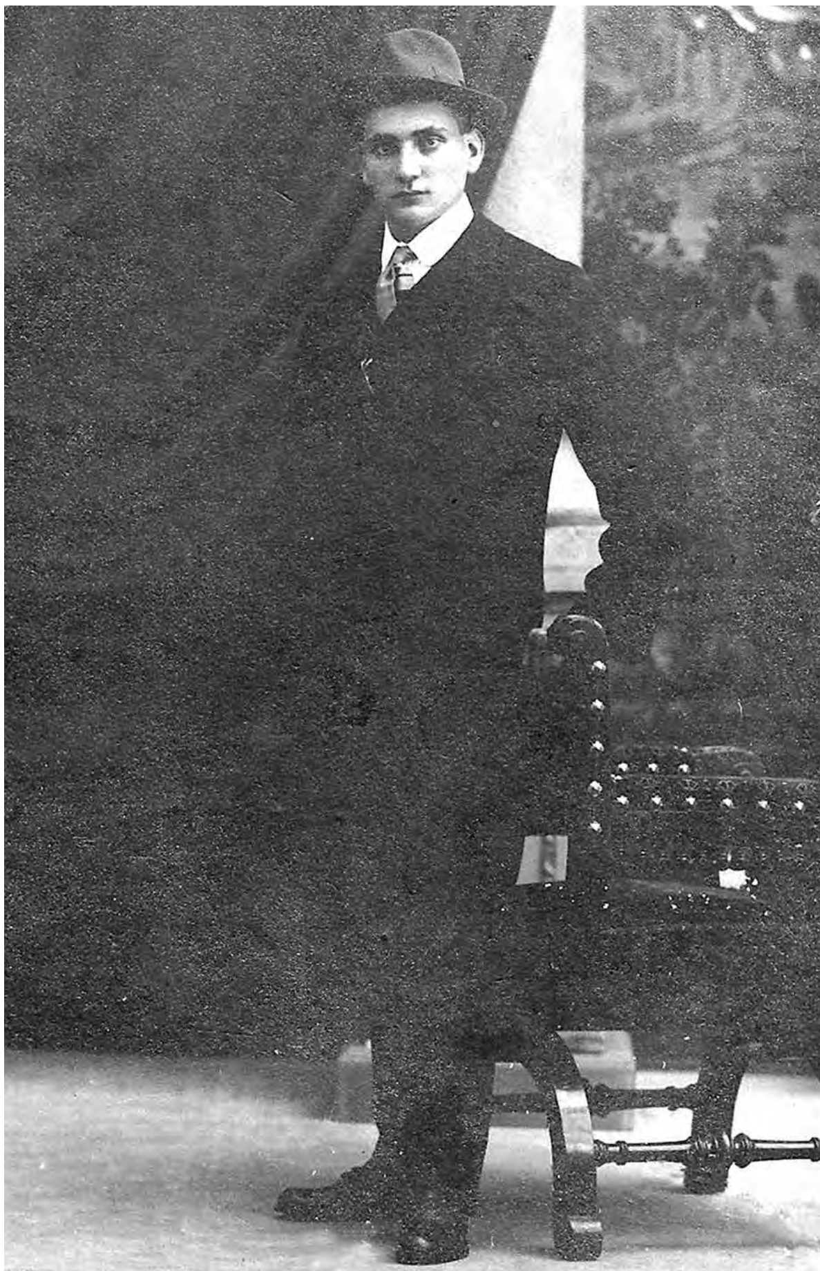
Josep Raventós i Casals