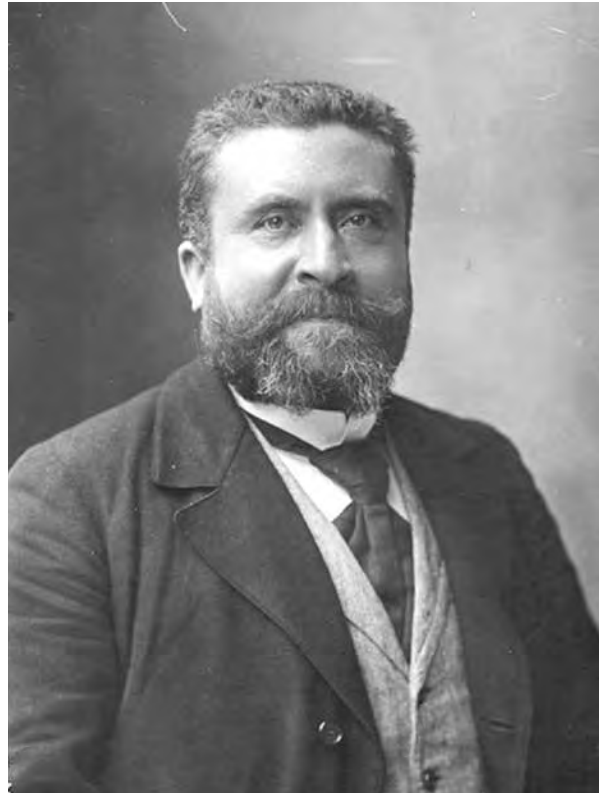
Jean Jaurès (1859-1914)

El dia 31 de juliol, al centre de París, queia assassinat Jean Jaurès, el dirigent socialista francès que més s'havia distingit en la lluita per la pau. L'autor del crim va ser un jove estudiant ultranacionalista francès. Només uns dies abans, el dia 25 de juliol de 1914, a Lió, Jaurès havia pronunciat un més dels seus abrandats discursos en contra de la guerra en què denunciava obertament la hipocresia de la diplomàcia europea (inclosa la francesa) i clamava perquè «el proletariat reuneixi totes les seves forces per evitar l'horrible amenaça» que