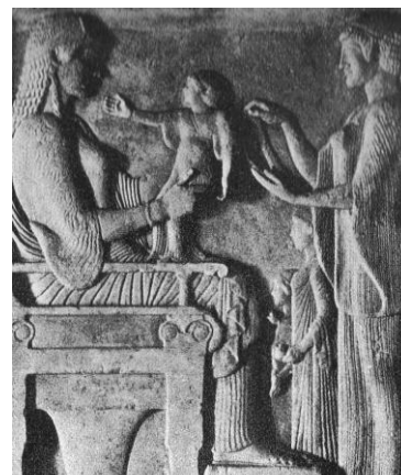
Il·lustració 1: Nodridora que presenta el fill a la mare moribunda per al darrer adéu. Estela funerària de Villa Albani (Roma) del segle VI a.C.

El primer que hem de destacar en aquesta educació és que les ensenyances es duien a terme de forma bilingüe distingint entre el llatí i el grec a més de l'accentuació de l'ús del llibre i de diferents manuscrits en contra del pensament i judici propi de l'alumnat. Llavors, l'educació romànica, i tal i