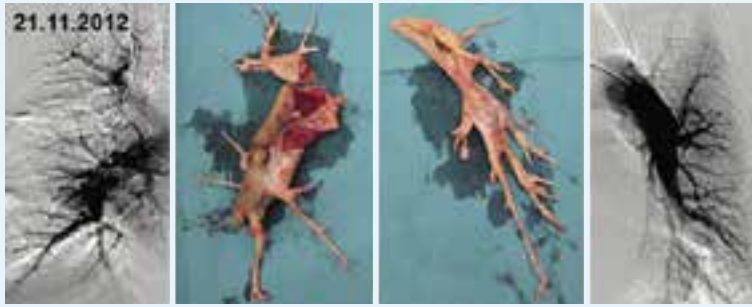
Kuva 1. Aiemmassa potilashistoriassa radikaalin ty- mektomian ja perikardiektomian jälkitila. NYHA III-IV -oireisen potilaan keuhkovaltimot puhdistettiin Helsin- gissä subsegmenttitasoja myöden. Taudin uusiminen menestyksellisen leikkauksen jälkeen on harvinaista, vain luokkaa 1 %.

dellisen hajoamisen CTEPH-potilailla, on huonosti ymmärretty.