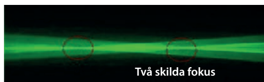
TECNIS® Multifokal intraokulär lins

Figur 1. Den monofokala linsen har ett distinkt fokus, jämfört med den multifokala linsen som kan ha två eller flera distinkta fokus. Synskärpan mellan fokus-punkterna kommer dock att vara relativt suddig på den multifokala linsen. (Bild AMO).