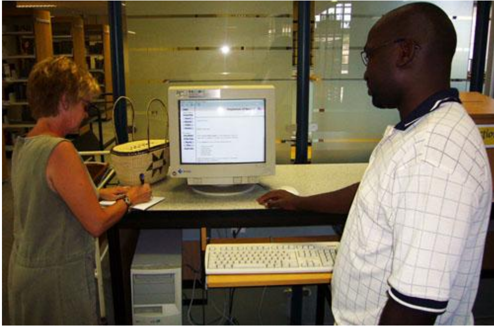
Polytechnicin kirjasto vaikutti lähes kadehdittavalta. Yllä kuvassa myös kirjaston kirjastoavustaja.