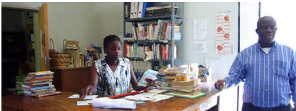
Se oli ainoa lukio Namibiassa, silloisessa Lounais-Afrikassa, johon Etelä-