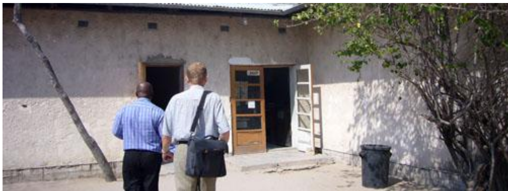
Oshigambo High Schoolin ovat perustaneet suomalaiset lähetystyöntekijät.