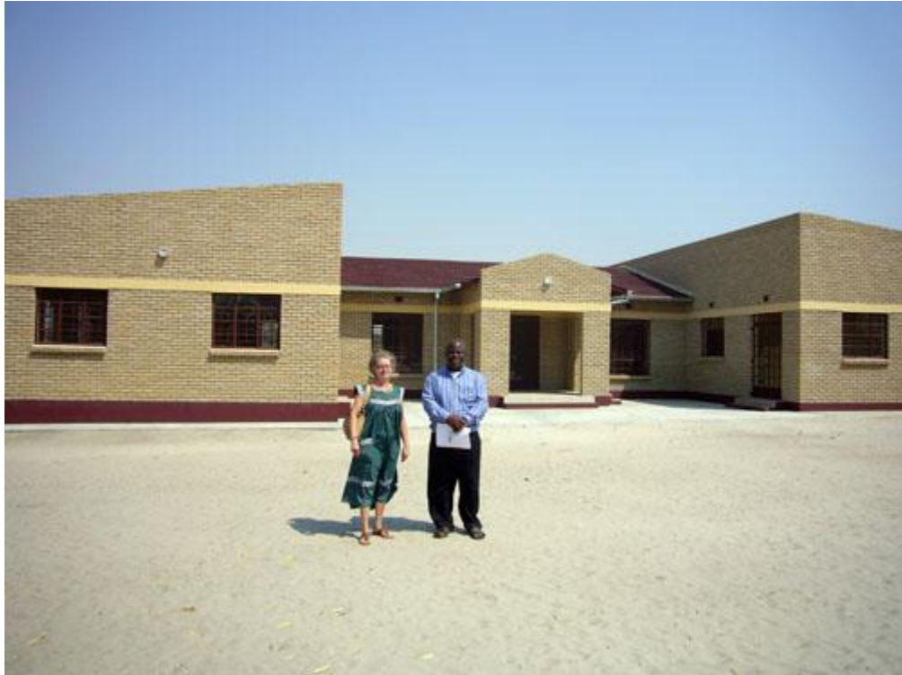
Ambomaalla Oshigambon lukiossa, noin 50 km päässä Oshakatista, on kaikkein uusin kirjastorakennus. Sitä ei ole vielä edes avattu.