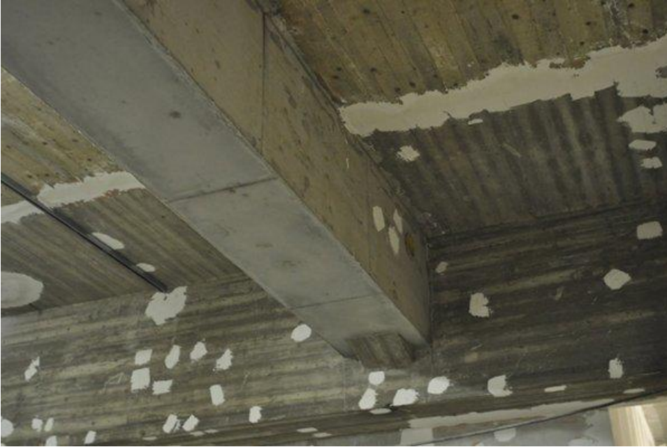
Kellarikerroksissa vanhoja säästyneitä rakenteita on paikoin vahvistettu betonipalkeilla.