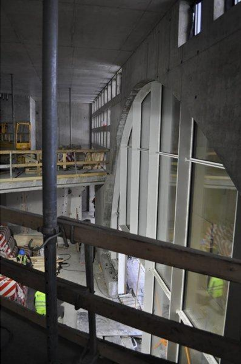
”Avaus” Kaisaniemenkadun puolella 3. kerroksessa.