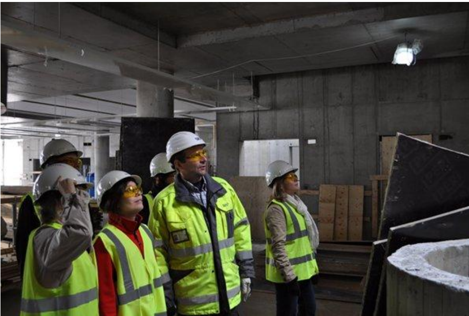
Rakennus sai aikaan ihailevia katseita!