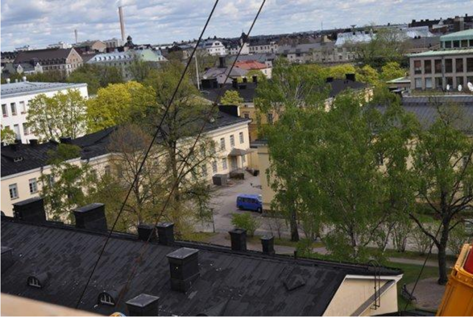
Katolta näki hyvin jopa viereisen Topelian sisäpihalle.