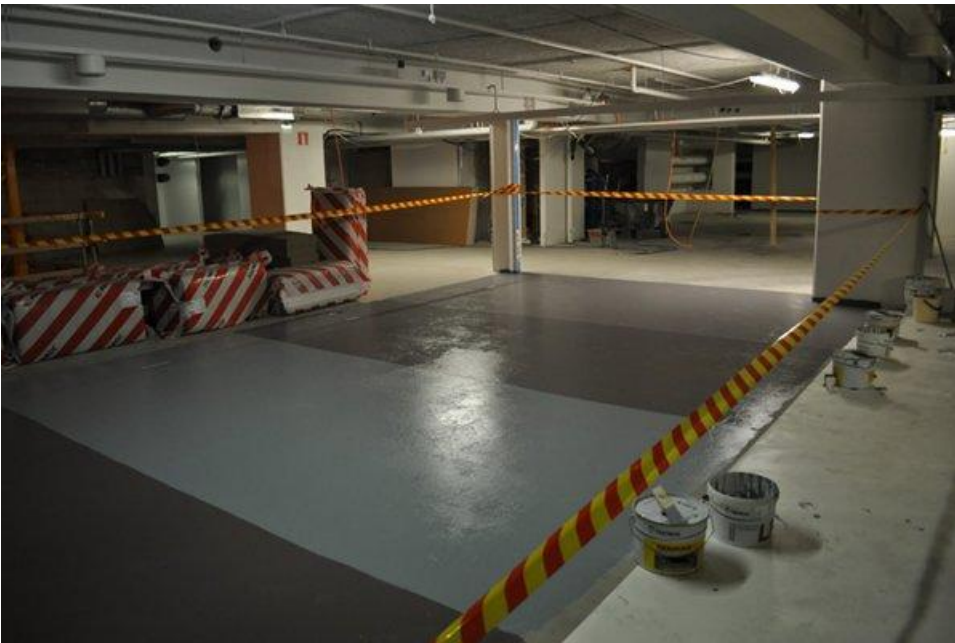
Tämä ei ollut uima-allas, vaan kellarikerroksen koemaalauksia – valinta oli: ei mikään näistä.