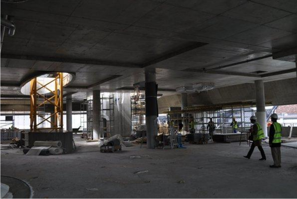
7. kerroksessa ulkoseinät puuttuivat vielä.