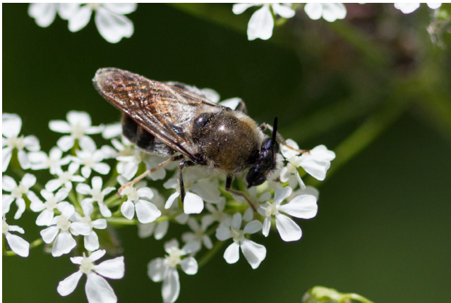
Kuva 1. Stratiomys longicornis . Sa: Lappeenranta 2013.

Kärpässuku Stratiomys on keskikokoinen hyönteissuku: maailmasta tunnetaan tällä hetkellä noin 93 Stratiomys -lajia (Woodley 2011). Euroopasta on löydetty 11 lajia (Rozkošný & Knutson 2013). Suvun kärpäset ovat suurikokoisia ja värittään pääasiassa voimakkaan mustakeltaisia, vaikka joukkoon mahtuukin muutama tummempi, ilmeisesti tummia mehiläisiä jäljitteleviä lajeja (kts. Kuvat 3–5).