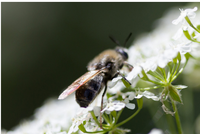
Kuva 2. Stratiomys longicornis . Sa: Lappeenranta 2013, kuvannut Harry Nyström.

Luonnossa aikuiset Stratiomys -kärpäset ovat yllättävän vaikeasti havaittavia, sillä lepäävät yksilöt peittävät osan kirjavasta takaruumiista siivillään. Lisäksi aikuisten elinaika on ilmeisesti lyhyt, joten vuosittainen lentoaika saattaa olla alle kuukauden pituinen. Parhaiten aikuisia löytää aurinkoisina ja tyyninä päivinä rehevien avokosteikkojen reunoilta, jossa ne istuvat matalassa kasvillisuudessa tai kukilla. Kukkista Stratiomys -aikuiset suosivat kasveja, joiden mesi tai siitepöly on helposti tavoitettavissa. Yleisimpiä ruokailukasveja lienevät sarjakukkaiset.