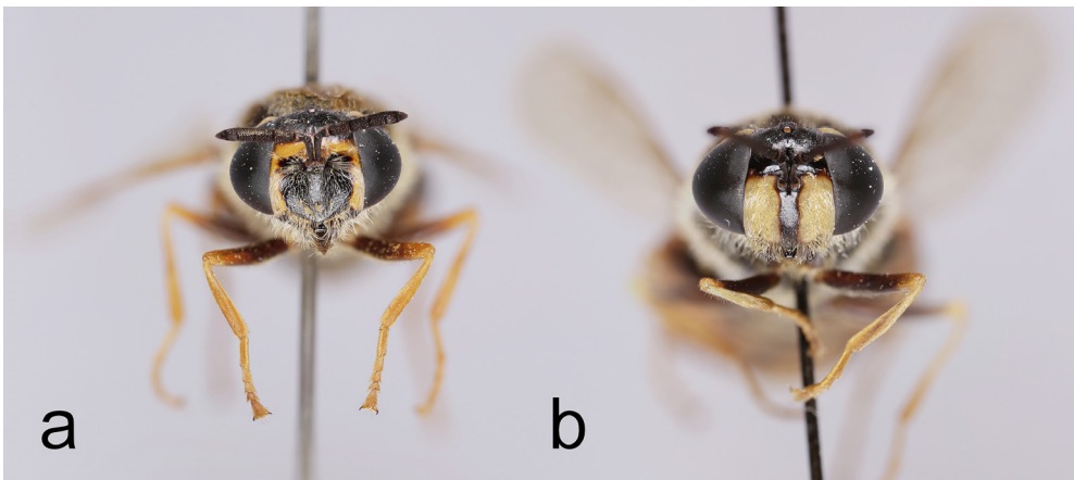
Kuva 5. Stratiomys , naaraiden kasvoja. S. equestris (a), S. potamida (b).

rinen toisin kuin S. singularior , jolla sääret ovat vähintään puoliksi tummat. Naaraat on helppo erottaa naaman värin perusteella: S. equestris -naaraiden naaman reunojen kapea keltainen reunus (Kuva 5a) puuttuu S. singularior -naarailta. Pää verkkosilmien takana on S. equestris -naarailta keltainen, S. singularior -naarailta musta. Lajien koiraat eroavat mm. silmien karvoituksen värin suhteen ( S. equestris vaaleakarvainen, S. singularior tumma), mutta tämän tunto-merkin käyttämiseen tarvitaan hyvä luuppi tai mikroskooppi.