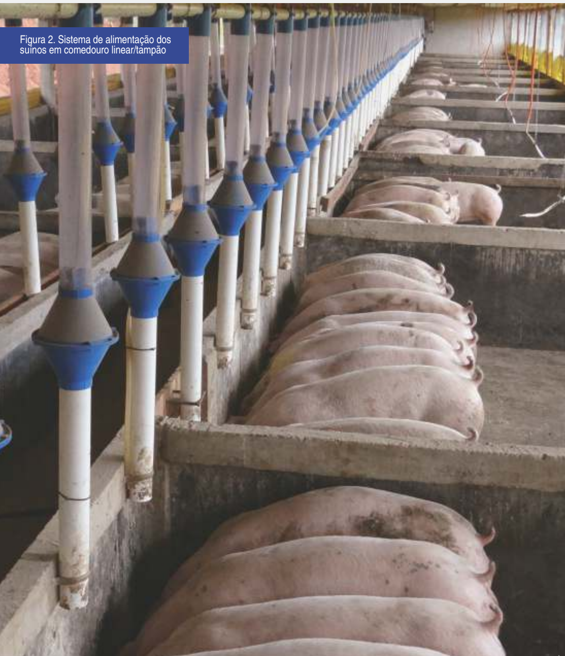
Figura 2. Sistema de alimentação dos suínos em comedouro linear/tampão