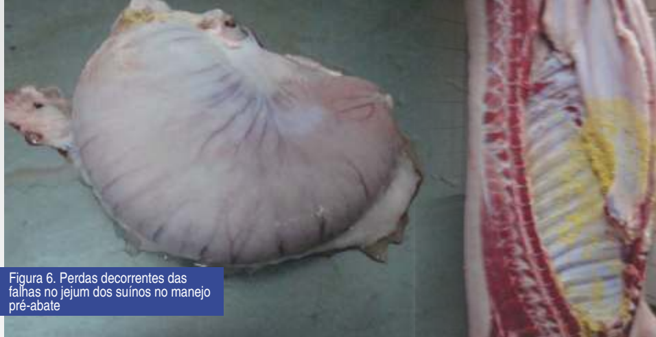
Figura 6. Perdas decorrentes das falhas no jejum dos suínos no manejo pré-abate