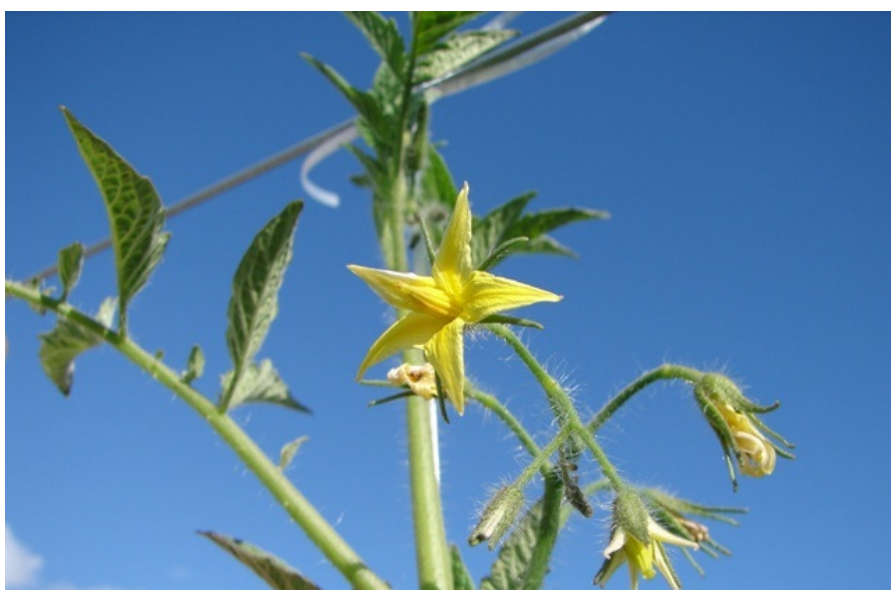
Momento certo para o ensacamento

áreas com estufas com laterais abertas, chamado “efeito guarda-chuva”, pois a cobertura é feita apenas nas regiões de altas precipitações, o que dificulta a prática do ensacamento.