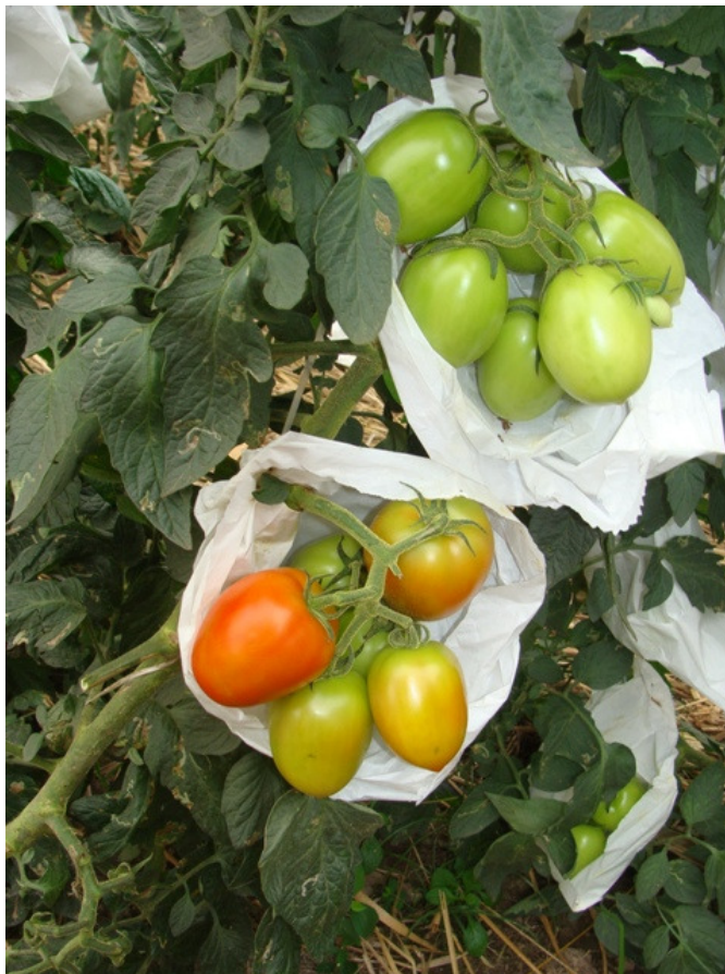
Técnica de ensacamento da flor do tomateiro

Essa matéria completa você encontra na edição de junho 2016 da revista Campo & Negócios Hortifrúti. Adquira já a sua para leitura integral.