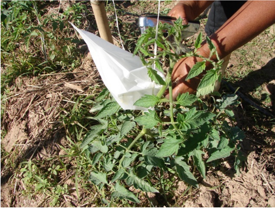
Momento certo para o ensacamento