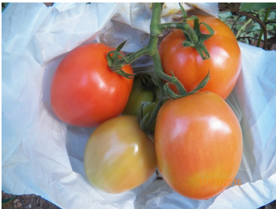
O ideal é deixar cinco frutos por penca

alimentam do endocarpo (polpa) dos frutos, permanecendo os orifícios de saída ao término do período larval.